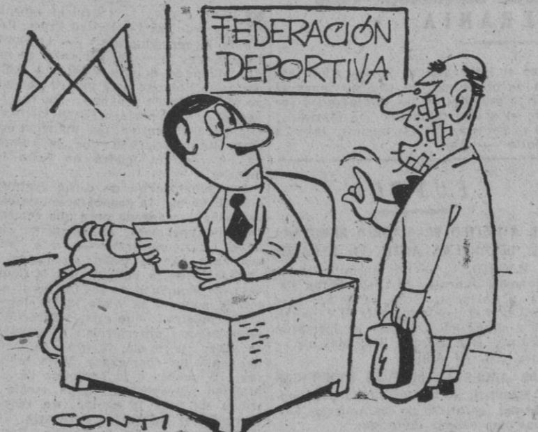
—¡Hace siete años que me afeito con la misma hoja! ¡Vengo a que me reconozcan como campeón mundial en mi especialidad!