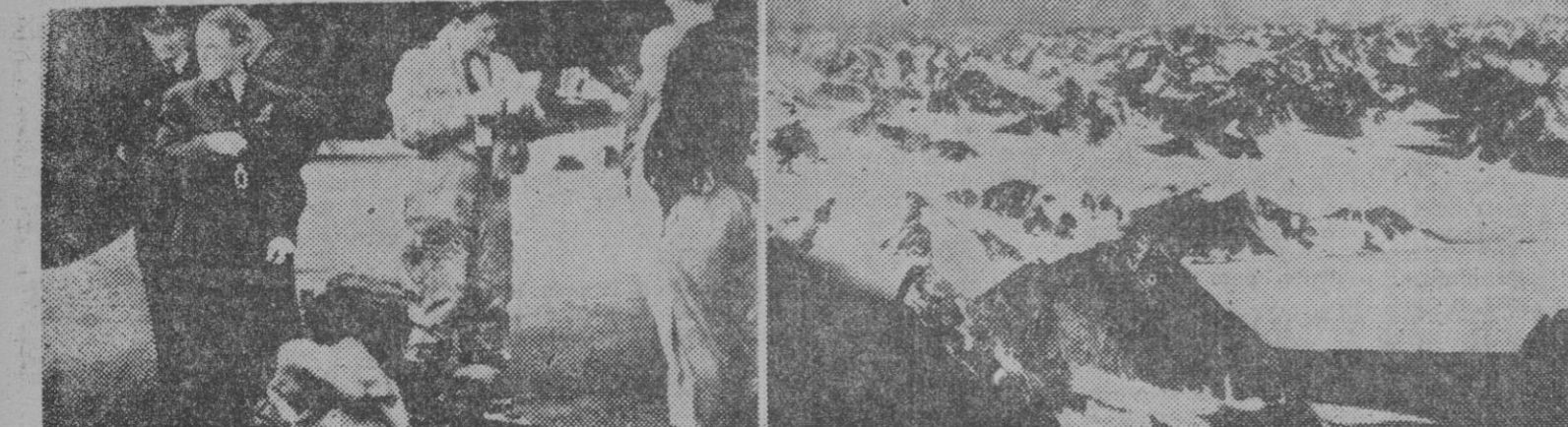
1. El capitán de la expedición aérea al Polo Norte, comandante E. Russell Bell (centro), al descender del avión que realizó la proeza, junto con otros compañeros de equipo. — 2. Vista de la costa de Groenlandia tomada desde el avión británico que ha volado sobre el Polo.