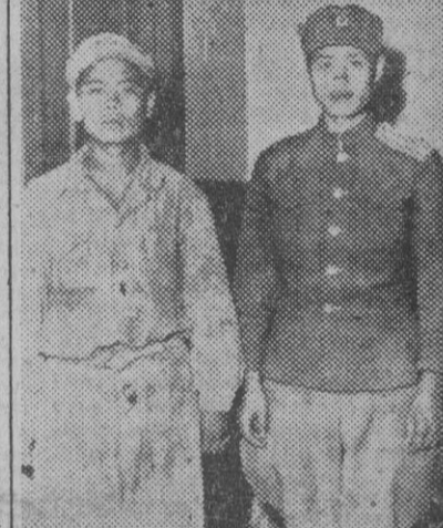
Este teniente coronel coreano (derecha) es, hasta el momento, el militar de más alto grado que los americanos han capturado en la guerra en curso. Mandaba un regimiento de Artillería y fue cogido con su ayudante, ambos sin identificar aún.