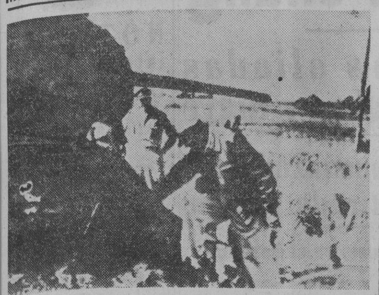
El general Mac Arthur durante su visita al nuevo frente de Inchon-Seul, contempla un tanque soviético que fué destruido por el fuego de los "baçoacas" americanos.