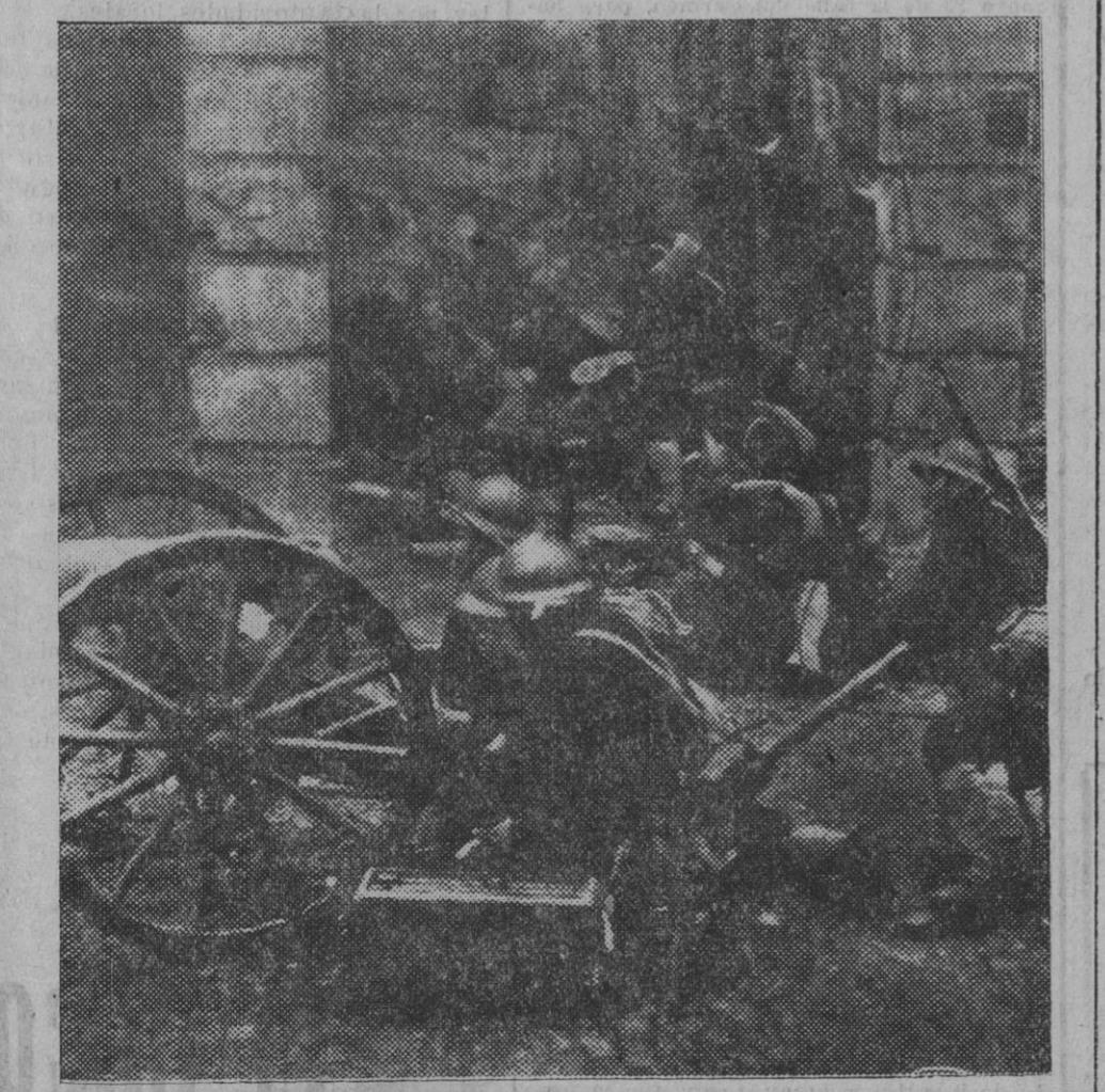
LA GUERRA CHINO JAPONESA De los últimos combates en Shang hai.—Fuerzas de artillería batiendo al enemigo en las calles en ruinas de Shanghai.

Recibimos un telefonema que dice así: "Comisión arbitral agrícola aprobada no haya limitación contratación remolacha próxima.—HUESO. misma obras de exagerada dimensión, y en número de tres como máximo, a cuyo efecto hará entrega del Reglamento de la Exposición y Boletines de inscripción a quienes los soliciten. Segundo.—Costear, sin otro compromiso de su parte, los gastos de transporte y retorno de las obras de pintura, escultura, dibujo, gravado, y arte decorativo que reciba al efecto indicado, desde el día de la publicación de esta nota hasta el día 15 de Abril próximo venidero. Pamplona 9 de Marzo de 1932. La Diputación y en su nombre, Constantino Salinas.—Luis Oroz, Secretario.