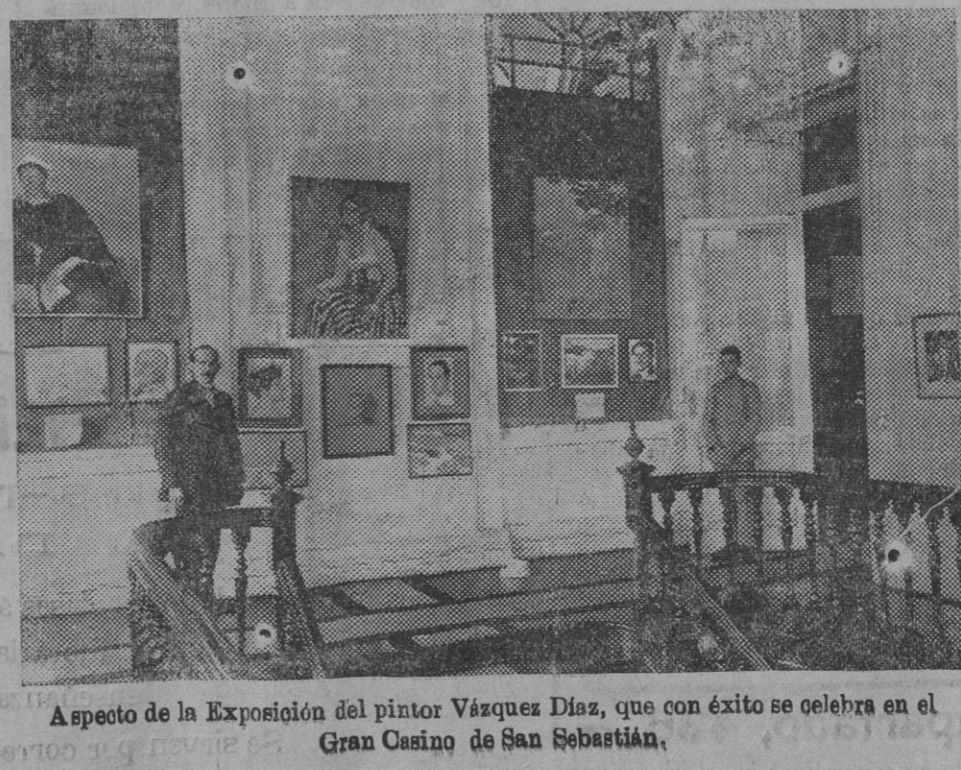
Aspecto de la Exposición del pintor Vázquez Díaz, que con éxito se celebra en el Gran Casino de San Sebastián.

tro Vives, probablemente, que será interpretado por la banda municipal y numerosos artistas de todos los teatros.