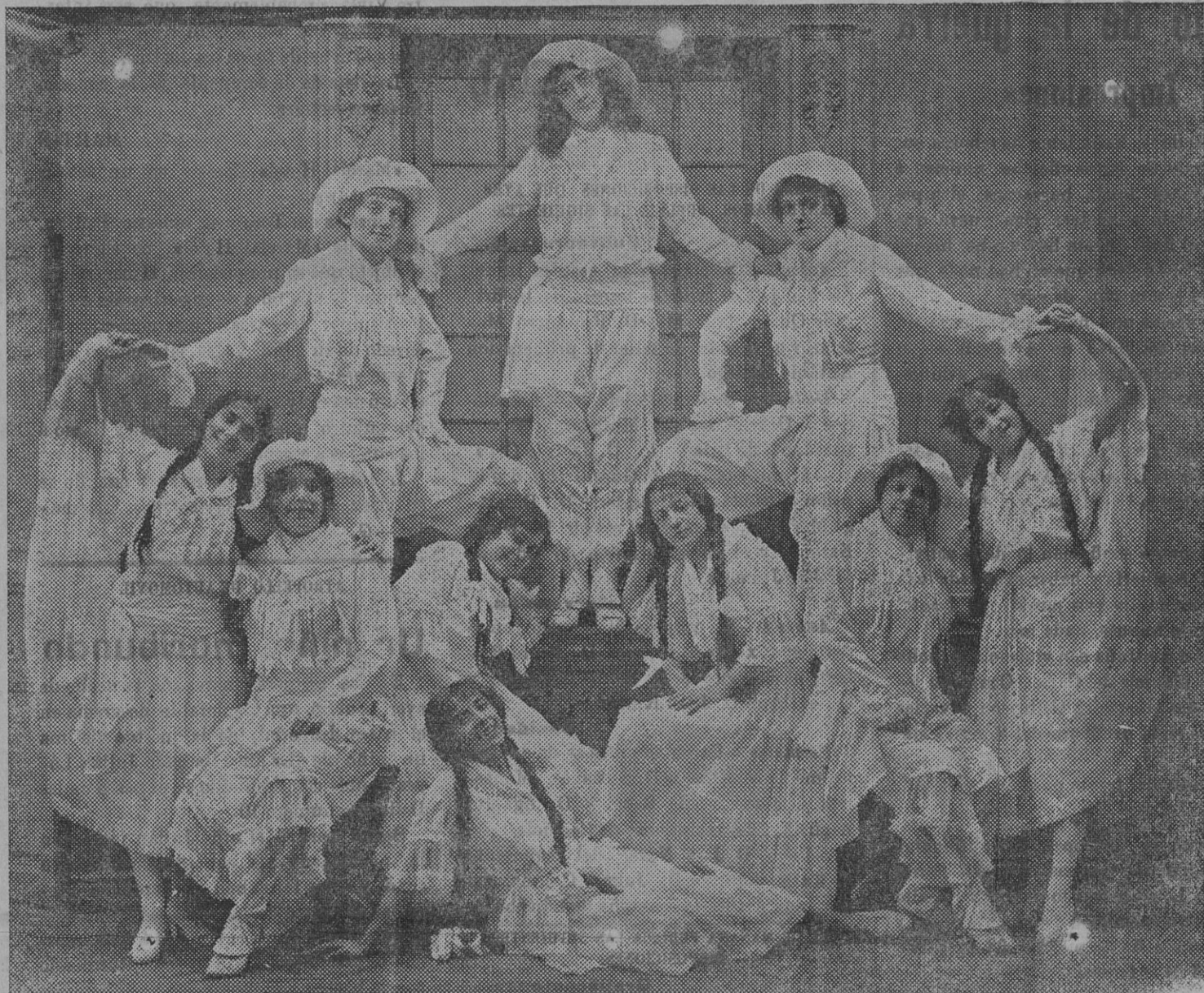
El truco de la Fuente del Amor, escena del vodevil «Federico el Grande», estrenado en el teatro de la Zarzuela. (Fot. Alfonso).