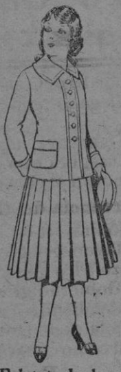
Paletó de lana para jovencitas de 13 a 16 años. De 12'50 a 20