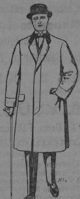
Gabanes de patén, melton y cheviot. De pts. 25 a 100