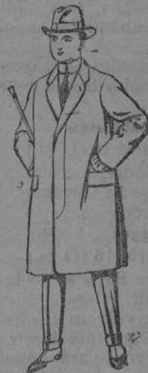
Gabanes de lana, vigonia o melton para niños de 10 a 16 años. De pts. 20 a 56

Gorras, Sombreros, Cinturones, Calcetines, Corbatas, Fajas, Ligas, Tirantes, etc.