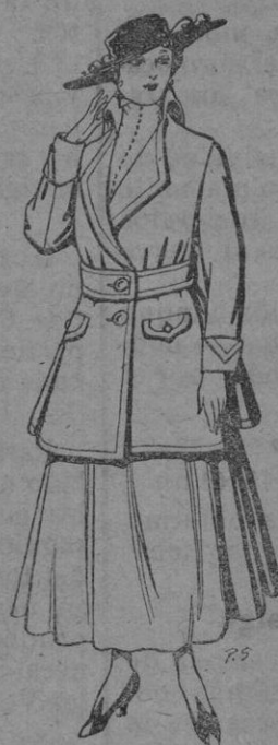
Abriego de patén gran novedad para Señora. De ptas. 26 a 40

Ultimas novedades en echarpes, manguitos, pelerinas, corbatas, abrigos, etc., en pieles de loutre, taupe, vison, renard, zibelino, ermíño, etc., auténticas e imitación perfecta.