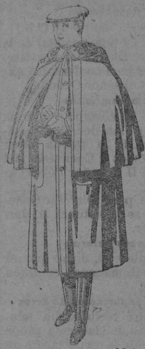
Impermeables forma Makferiaad en negro y azul. De pesetas 55 a 110