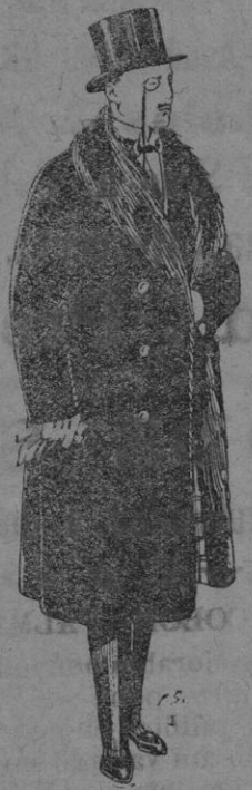
Gabanes de edredón negro, forro seda, cuello y vistas de piel a ptas. 125 y 135

MADRID, BARCELONA, ALICANTE, ALMERIA, BILBAO, CADIZ, CARTAGENA, GIJON, GRANADA, MALAGA, SANTANDER, SEVILLA, VALENCIA, VALLADOLID Y ZARAGOZA