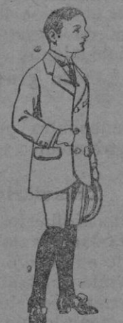
Trajes de patén para niños de 7 a 12 años. De pts. 16 a 30