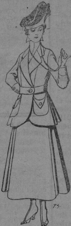
Trajes de lana negra, azul y color, para Señora. De pts. 50 a 55