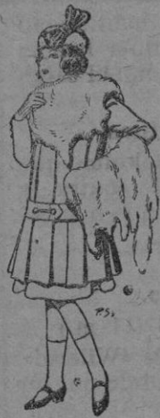
Juego de pieles para niños. A pesetas 15