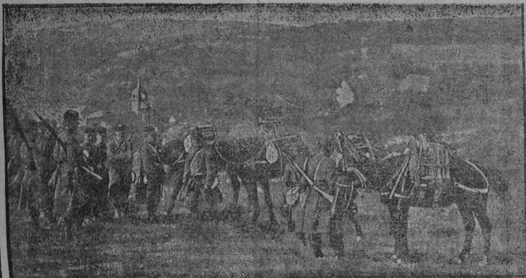
Algunas ametralladoras empleadas por el ejército francés y montadas sobre caballos.