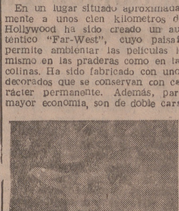
En un lugar situado aproximadamente a unos cien kilómetros de Hollywood ha sido creado un auténtico "Far-West"...

Los comparsas vestidos de pieles rojas resultan más caros que los indios auténticos. Actualmente se ruedan más de cien películas de "cow-boys"