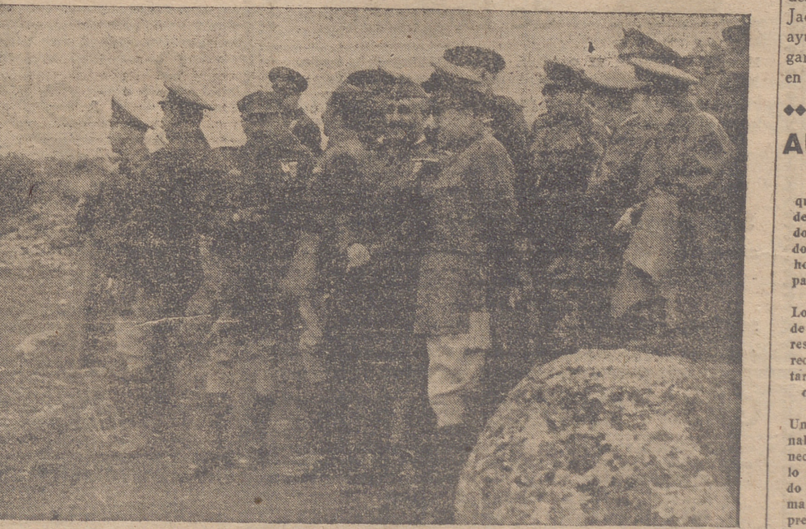
MADRID.—S. E. el Jefe del Estado, Generalísimo Franco, acompañado de jefes y oficiales, presenciaba las maniobras militares que celebra la XI División, en Oñate, en el Valle de Arriba.