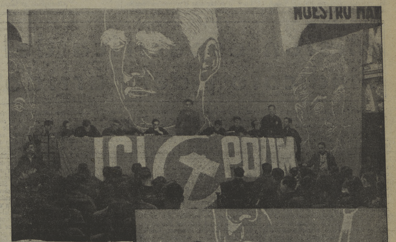
Ayer empezaron las sesiones de la Conferencia de Barcelona de la Juventud Comunista Ibérica. Las fotos presentan dos aspectos de la Conferencia durante las tareas que ayer, mañana, tarde y noche, ocuparon a los representantes de la Juventud revolucionaria española.

Ayer, a las once de la mañana, se abrieron las sesiones de la Conferencia de Barcelona de la J. C. I. La Sala Mozart presentaba un brillante aspecto. El número de asistentes a la primera sesión, era numerosísimo, llenando totalmente el local. Por otra parte, la decoración del local de un severo estilo, realzaba aún la brillantez del acto.