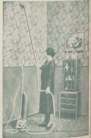
“Dandy” A. E. G. GARANTIZA BRILLO “ESPEJO”