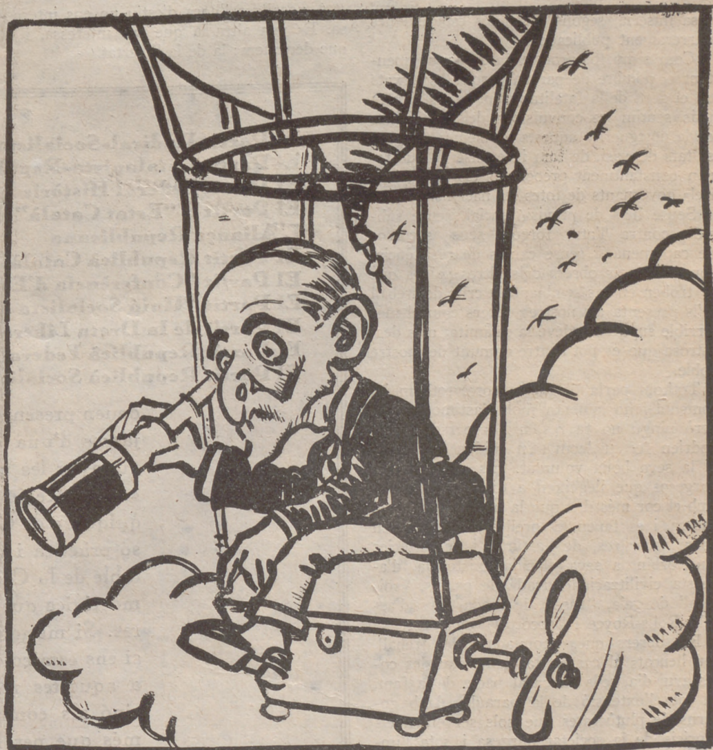
La política de Cambó

—Com que aquests aires tan alts curteixen molt la pell, ja em poden dir el que vulguin.