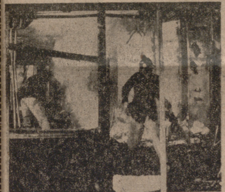
NOTTINGHAM (Inglaterra).—Los bomberos durante los trabajos de extinción del incendio en una residencia de ancianos. Hubo que lamentar dieciocho muertos.

EDWALTON (Inglaterra), 16. (Efe).—Dieciséis mujeres y dos hombres han muerto al declararse un incendio en el hogar de ancianos donde se alojaban, situado en Edwalton, Nottinghamshire.