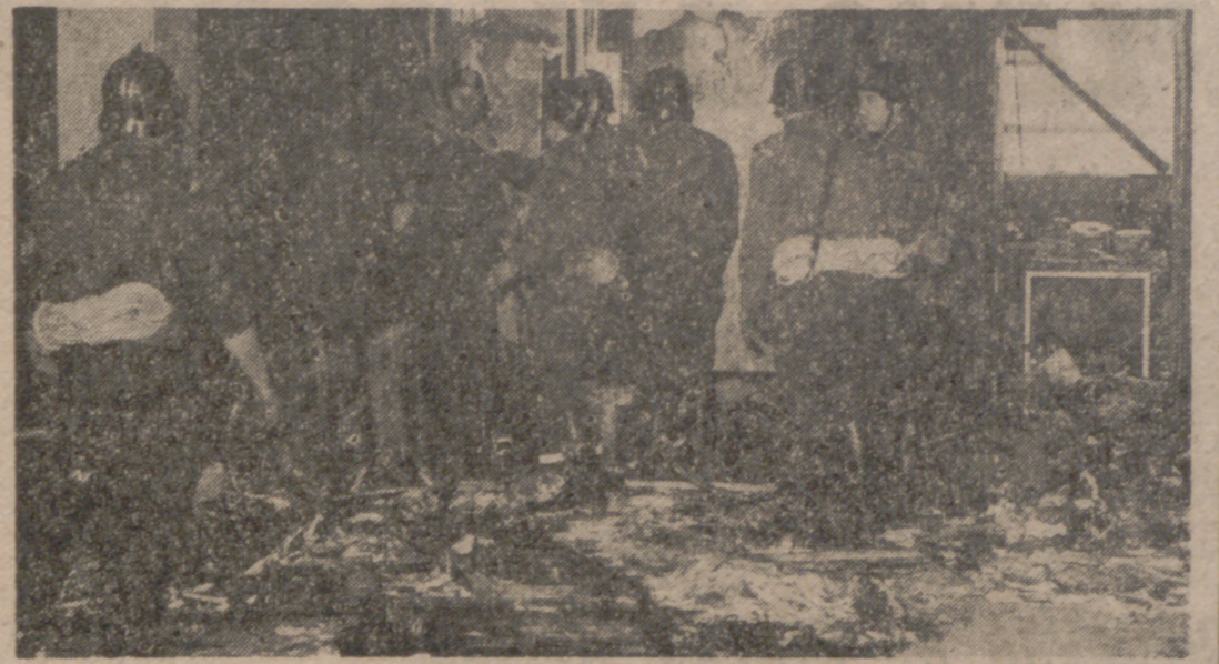
MADRID.—En la sede de UNIVAC, en la Avenida de las Américas, se registró a primeras horas de ayer un aparatoso incendio. Si bien hubo pérdidas materiales cuya cuantía se desconoce hasta el momento, no así víctimas personales. La foto recoge un momento de los trabajos de extinción por parte de los bomberos, que se personaron rápidamente en el lugar del siniestro.