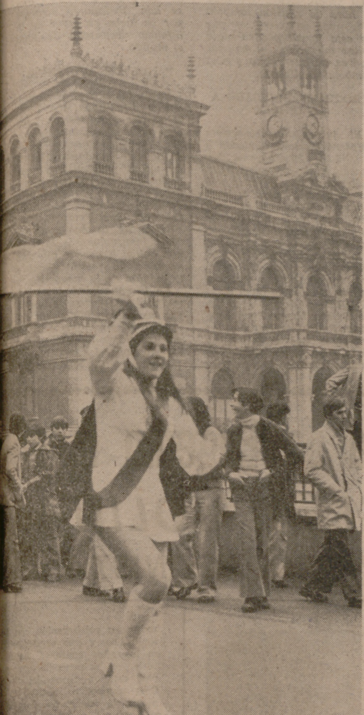
Veintiocho muchachas y cuarenta músicos han desfilado ayer por las calles vallisoletanas. Valladolid ya tiene su primer grupo de «majorettes». Vamos progresando.