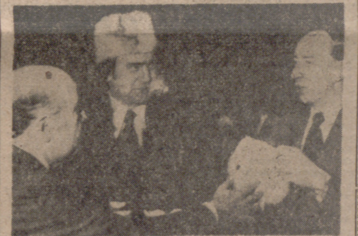
MONTREAL (Canadá).—En la parte superior de la foto, grupos de manifestantes portan carteles y pancartas en tanto prorrumpían en gritos contra el Gobierno iraní ante la Embajada del Irán. Abajo, el jefe del Gobierno iraní, Jamr Abbas Hoveyda (izquierda), en el interior de la Embajada, ofrece sombreros al ministro de Comercio e Industria de Quebec, Guy Saint Pierre (centro), y al ministro federal de Sanidad y Bienestar, Marc Lalonde. Los ministros de ambos países han iniciado conversaciones en torno a un propuesto acuerdo comercial entre sus respectivos países.