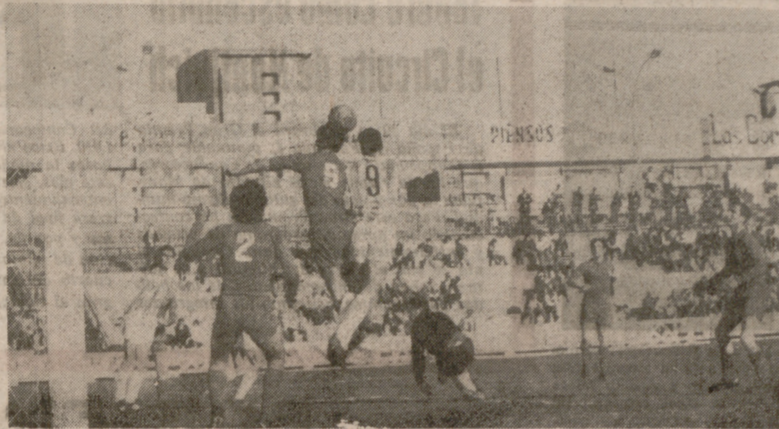
Los dos arietes junto al área zamorana. El visitante es quien logra despejar.

Con anterioridad, el Real Valladolid aficionado y el Tarancón empataron a un gol en encuentro amistoso