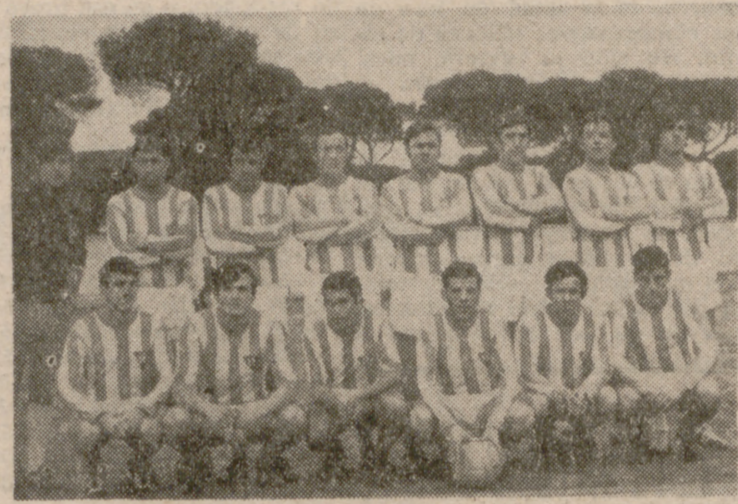
El Atlético Valladolid, vencedor del Santovenia, en el grupo tercero de Segunda Regional.

El resultado más amplio de la jornada lo consiguió el San Pío X a costa del Atlético Girón. Están muy fuertes, como ya demostraron en el Campeonato de Aficionados, los muchachos del San Pío X, y no ha sido suficiente el entusiasmo del At. Girón para neutralizar la superior clase enemiga. Uno tras otro, hasta cinco, fueron cayendo los goles en la red del Atlético Girón y aún pudieron los vencedores aumentar su sustan-