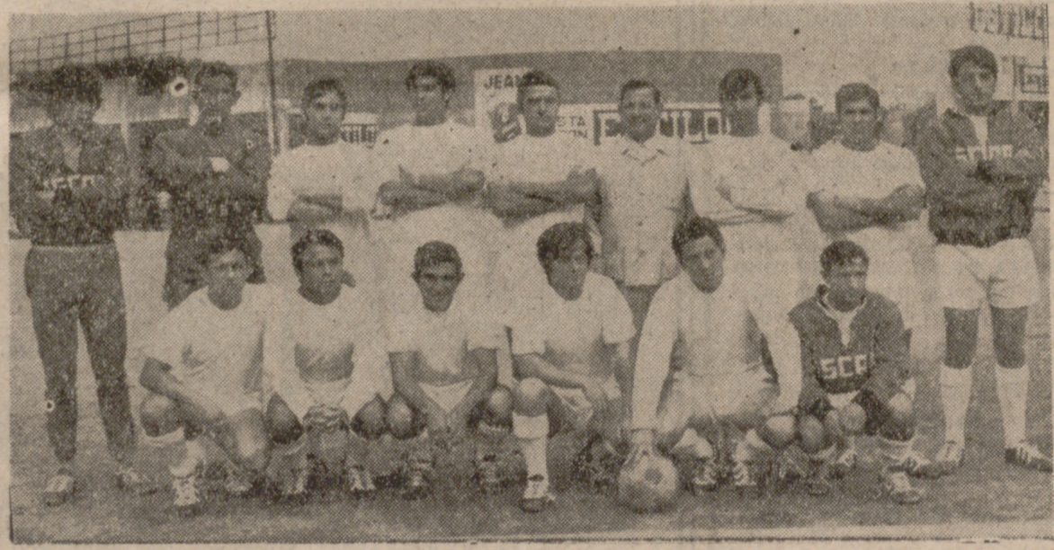
Una formación del Iscar de la presente temporada. Ayer, los iscarcienses salvaron un difícil escollo, venciendo al Béjar.