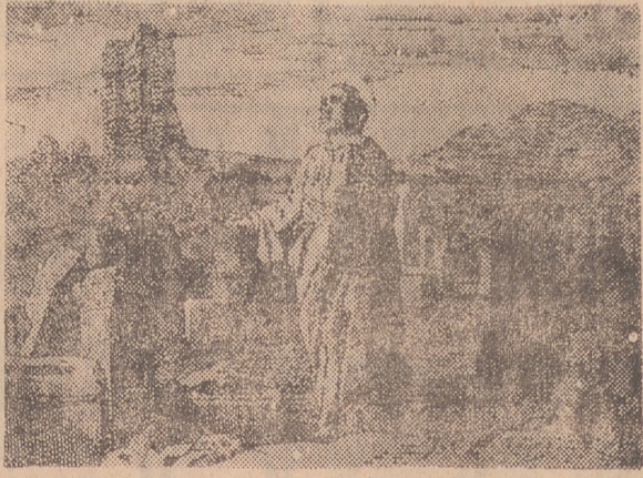
SAN EGESIPLO, AUTOR ECLESIASTICO († 181)