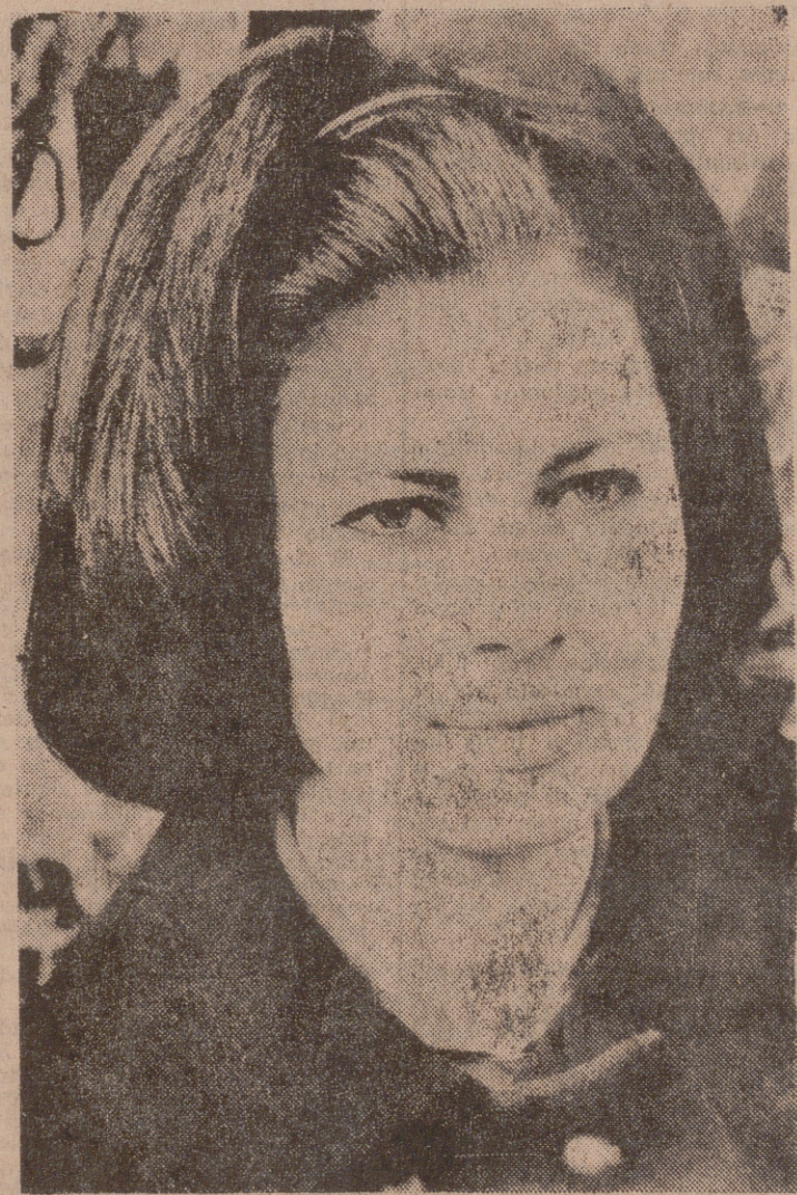
Este es el "nuevo rostro" que los magos de Cinecittá han dado a la exemperatriz Soraya, que se prepara para afrontar la cámara tomavistas. Las "correcciones" dadas a la futura actriz son evidentes; una sabia intervención quirúrgica le ha conformado la nariz y el labio ha adquirido un dulce encanto. Pero la transformación más ostensible ha sido en su cabello, que deja ahora una frente más amplia. Se ignora a estas alturas quién dirigirá a Soraya y quién compartirá con ella el primer papel masculino. Aunque han empezado a sonar nombres, entre los que —sorpresa— figura el del joven actor español Simón Andreu, lanzado a la fama internacional tras su película con Michele Morgan.