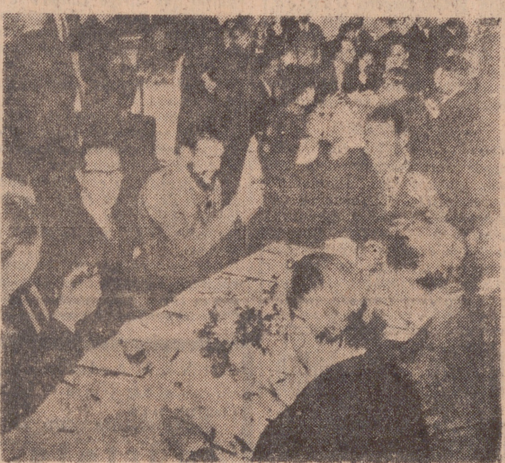
Los delegados y representantes de diversos países en la Conferencia Mundial de Comercio, que se ha celebrado en Ginebra, entre sesión y sesión de trabajo, almuerzan juntos. En una de estas comidas, el ministro español de Comercio, Ullastres, aparece sentado a la derecha del representante cubano, "Che" Guevara. Ullastres comparte también la mesa con el delegado del Paraguay, a su derecha, y diversos representantes de color que participaron en la Conferencia.