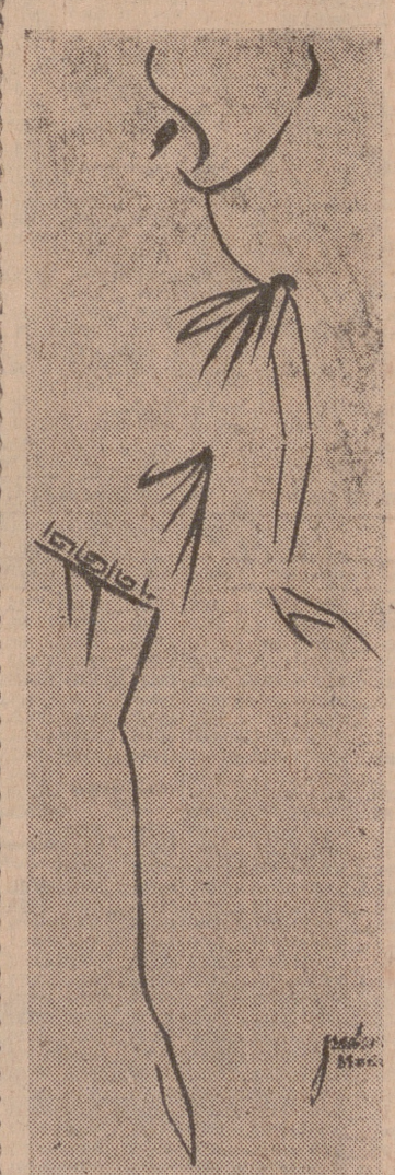
Modelo de «Clámides», túnica corta, que lucirán en uno de los desfiles ante el público y jurado las misses regionales finalistas.

Las proposiciones podrán presentarse en el Negociado Tercero (Obras) de la Secretaría General de este Ayuntamiento, donde se halla de manifiesto el expediente de la primera subasta. Lo que comunico para general conocimiento. Valladolid, 4 de abril de 1964.—El Alcalde, SANTIAGO LOPEZ GONZALEZ.