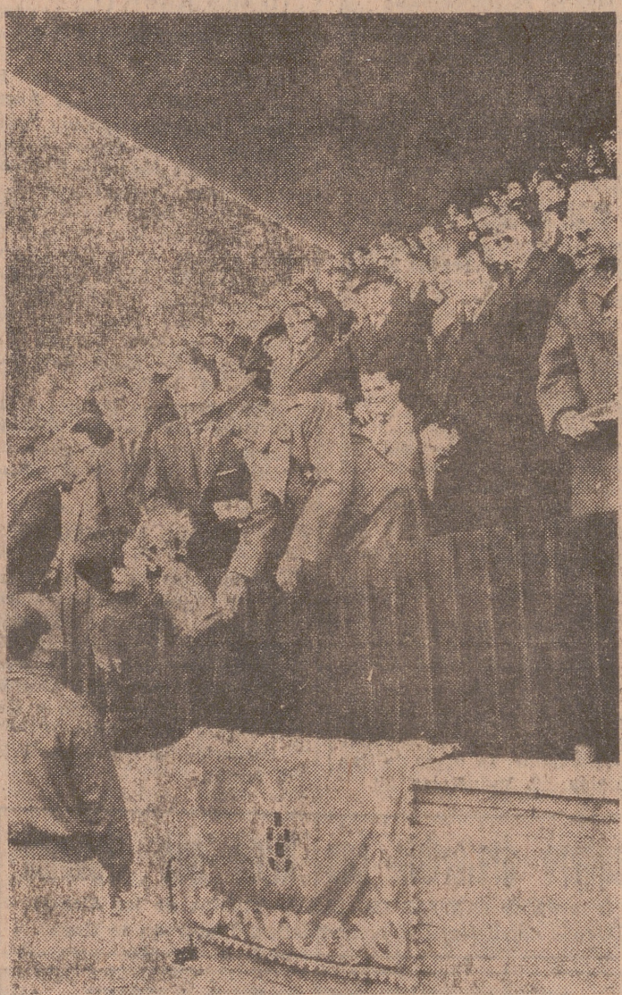
MADRID.—Después de la última jornada de atletismo, tuvo lugar el domingo por la mañana, en el Estadio de Vallehermoso, la solemne clausura de los Juegos Escolares Nacionales, a la que asistió el vicepresidente del Gobierno, capitán general Muñoz Grandes, que hizo entrega de los premios.