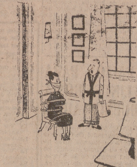
—Hago esto para que escuches la conferencia que voy a leer mañana.

SOLUCION A CRUCIGRAMA EN LA SECCION DE ANUNCIOS ECONOMICOS.