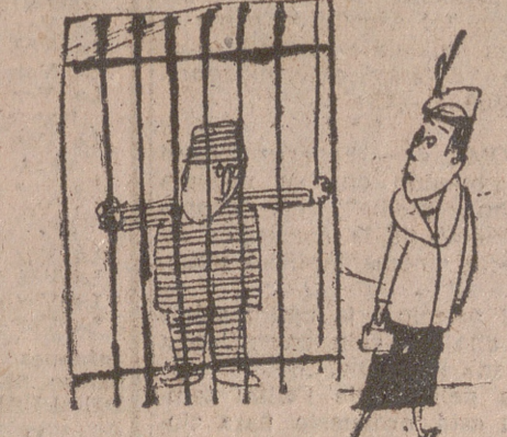
—No te olvides de comprarme un pijama, pero que no sea de rayas.