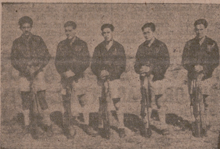
Equipo campeón de España de tiro a precisión.

El pasado domingo llegó la muchachada vallisoletana procedente de Palma de Mallorca, lugar donde se han celebrado los Campeonatos Nacionales del Frente de Juventudes de Tiro, Natación y Ciclismo.