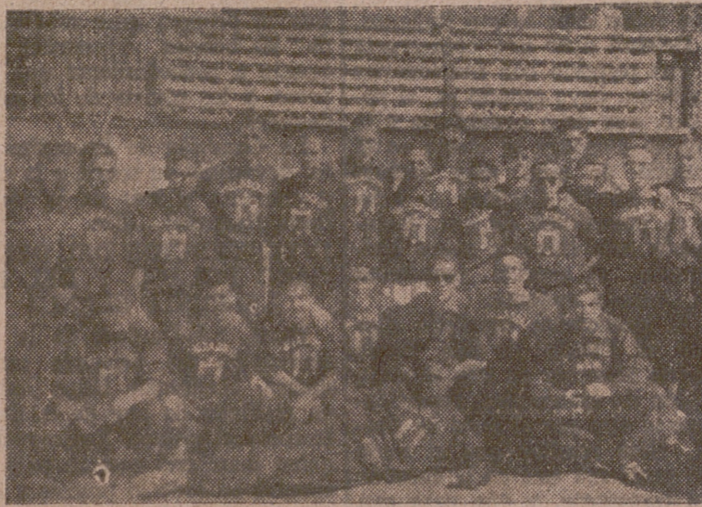
El equipo de Valladolid a su llegada al puerto de Palma.