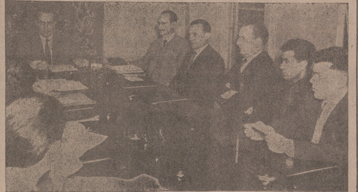
El Gobernador Civil presidiendo la reunión celebrada.

El Gobernador Civil presidió la reunión de la Hermandad de Excombatientes de la División Azul Fueron designadas las distintas comisiones