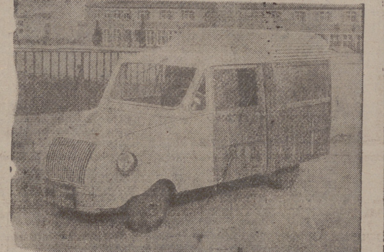
FURGONETA INDUSTRIAL METALICA - BISCUTER, 1-2 PLAZAS, 250 KG. CARGA.