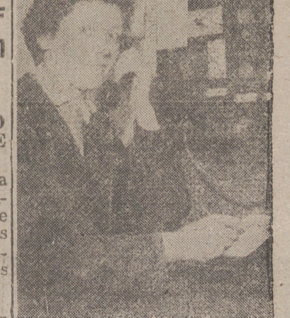
PARIS. — Con el fin de paliar las dificultades para la contratación de personal masculino en el ferrocarril subterráneo, la Dirección de dicha Compañía ha tomado la decisión de emplear como jefes de estación a cinco mujeres, tras un concurso entre 126 candidatas. En la foto, una de las "jefas" en su nuevo puesto.