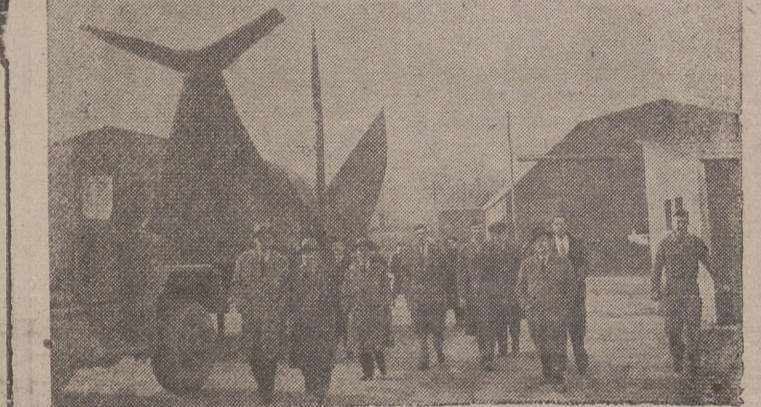
BITBURG. — Los periodistas españoles que han visitado estos días las bases aéreas norteamericanas en Alemania, fotografiados en las famosas rampas de lanzamiento de los proyectiles "Matador".