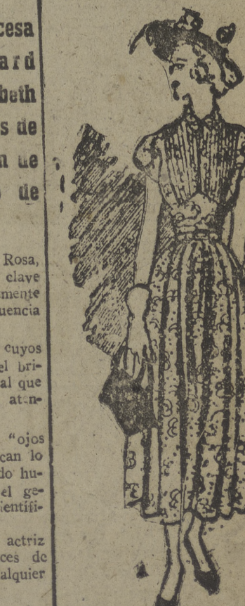
Este delicado vestido de seda natural es color azul pálido estampado en verde oscuro; está indicada para llevarlo durante el día. Cuello pequeño, pechero plisado y falda amplia fruncida por delante y sesgada en la espalda.