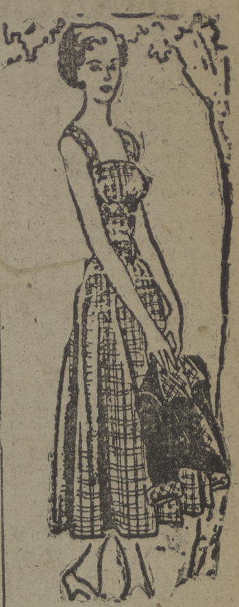
Bonito vestido para pasar el fin de semana en el campo. De algodón azul y blanco, con chaqueta de lino azul marino, cuello y puños de la tela del vestido. El modelo es el indicado para tomar el sol. Lleva unas anchas hombreras para sostener un corpiño ajustado, acentuado debajo del busto por una franja ceñida que, así como la del cinturón y los hombros, se de la tela del vestido, utilizada al sesgo. La falda es bastante amplia.

El doctor Marschutz dice que los ojos de miss Scott "son los ojos más raros" de tantos ojos de estrellas de cine ha visto.