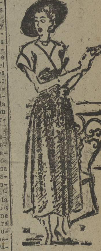
El shantung ha caído de la categoría de tipo sport, pasando a la categoría de vestido elegante. Este es un bello conjunto de falda y blusa en colores de contraste, o quideca para la blusa y violeta oscuro la falda. Las mangas llevan unos puñitos vueltos, la falda muy amplia, recogida en la cintura con un estrecho cinturón que termina en dos flores, siendo éste un bonito detalle.