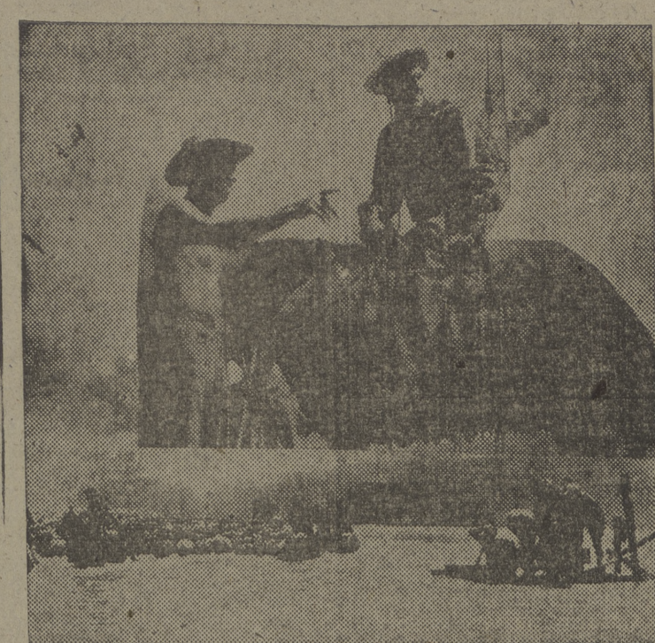
Se proveyó a los vaqueros de un aparato portátil de radio, con su correspondiente antena, para dirigirse mejor. Fotografiando el paso de un rebaño por el río, desde una balsa construida a propósito.

La película "Rio Rojo", que por los productores de "Rio pinta la vida en las llanuras; Rojo" recorrieron más de dos mil del Oeste de los Estados Unidos mil cuatrocientos kilómetros dos hace un siglo, es un ejemplar por cinco Estados de la Unión,