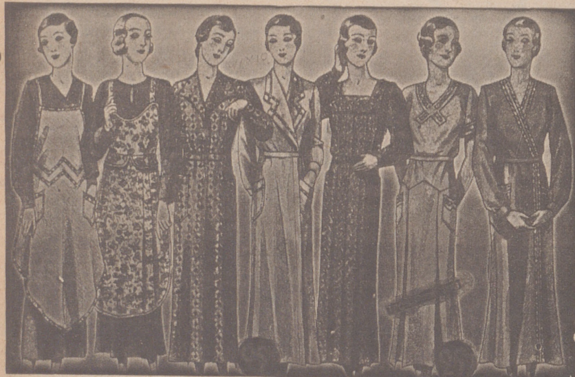
Vestidos, batas, kimonos de bañistas, percales o trovalcos, de 7, 8, 9, 10, 12 y 14 ptas

Casa Munguía ( Plaza Mayor, 48 y Lain Calvo, 9 Sucursal Plaza Mayor 5 BURGOS Primera casa en confecciones para caballero, señora jóvenes y niños Tejidos, Pañería y Sustrería