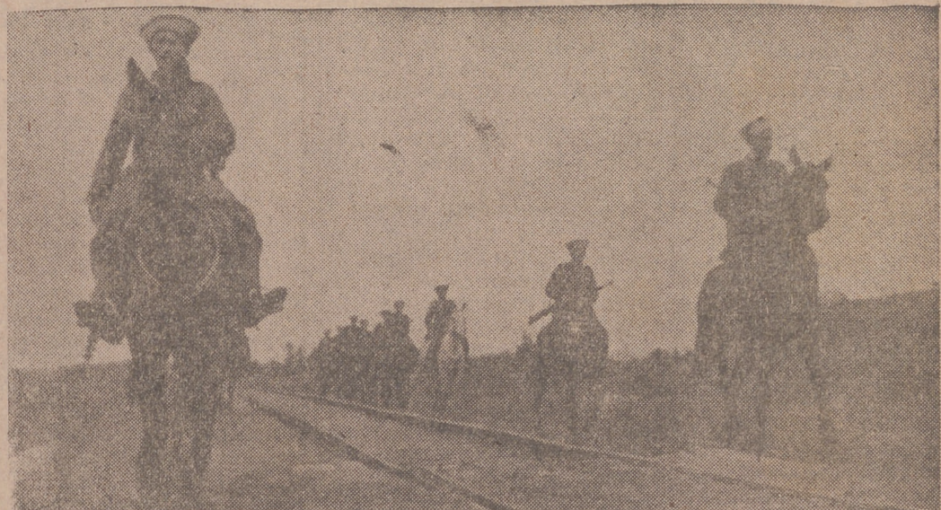
A lo largo de la vía férrea pasan los cosacos en servicio de vigilancia contra los ataques de las bandas comunistas.—(Orbis-Foto).