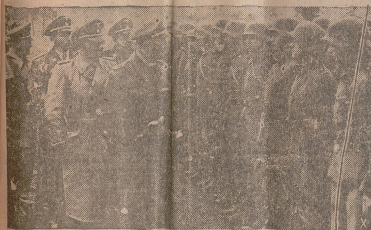
El reichsführer de las S. S., Heinrich Himmler, inspeccionando una división de voluntarios rumanos que se prepara con instrucción profunda para el combate

Alrededor de Caen es especialmente duro el choque de elementos blindados