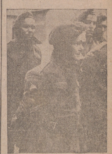
Tropas especiales y paracaidistas anglo-americanos capturados por soldados del Reich en el frente de invasión.