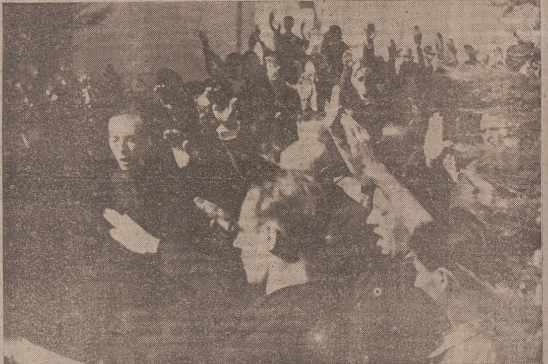
Momento de entonar el jefe provincial, camarada Rivero, el "Cara al Sol" ante la tumba de ONESIMO REDONDO