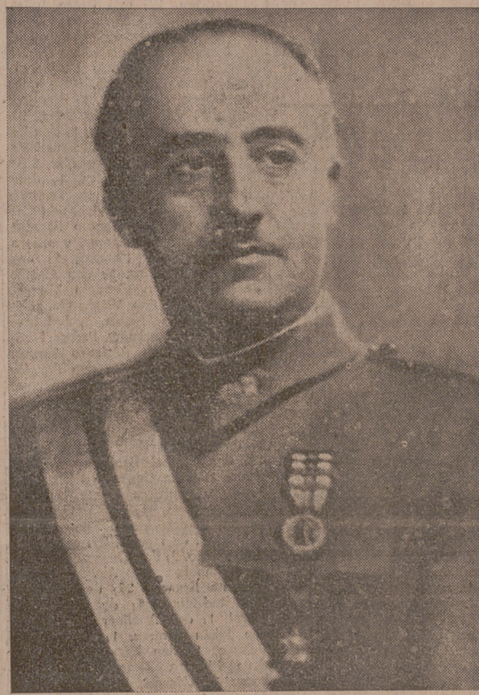
ovación interrumpe al Caudillo, que no puede terminar la frase.

La ovación que corona las últimas palabras de Su Excelencia dura largo rato, y sólo se acalla al ser interpretados los himnos del Movimiento y el Nacional, dándose las voces de ritual por el propio Jefe del Estado.