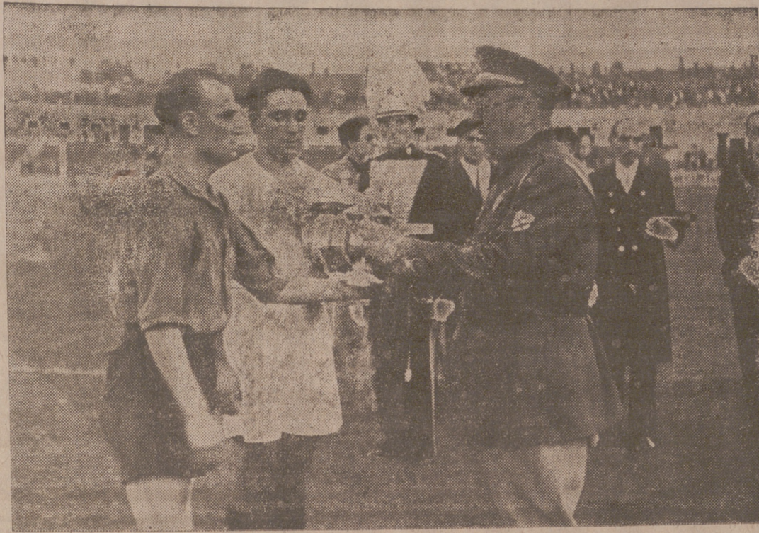
El general Moscardó haciendo entrega de la copa

Hay inmediatamente después un nuevo momento de apuro para Al-