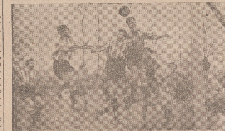
El conjunto del «Osasuna» que triunfó el domingo en «Las Gaunas», y un acoso de los logroñesistas a la puerta de Cabañas, como se ve, perfectamente defendida.