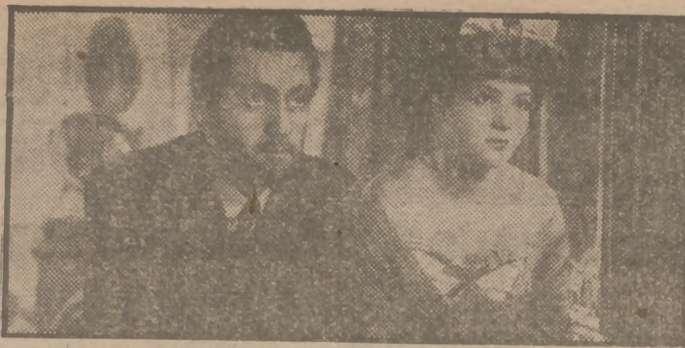
El protagonista de "Mariona Rebull", José María Seoane, con Sara Montiel en una escena de esta superproducción de Estudios Ballesteros, dirigida por Sáenz de Heredia.