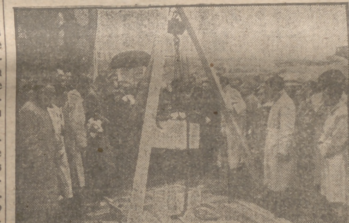
Después tuvo lugar la colocación y bendición de la primera piedra del edificio que habrá de ocupar el nuevo Colegio Mayor en la Ciudad Universitaria.