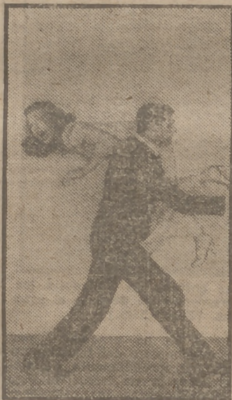
He aquí una graciosa escena a cargo de Priscilla Lane y el aplaudido actor Cary Grant en el film "Arsénico por compasión", realización del genial Frank Capra, de próximo estreno en Madrid, presentada por la Warner Bros.

de las útiles experiencias sufridas. "Reina Santa", cúspide de un arte evocador, es también ejemplo de técnica, de ritmo, de composición plástica y de fidelidad histórica. Sus imágenes, servidas por el realizador y los intérpretes con emoción y justeza, expresan definitivamente los puros valores del cine español dentro de las normas del cine universal.