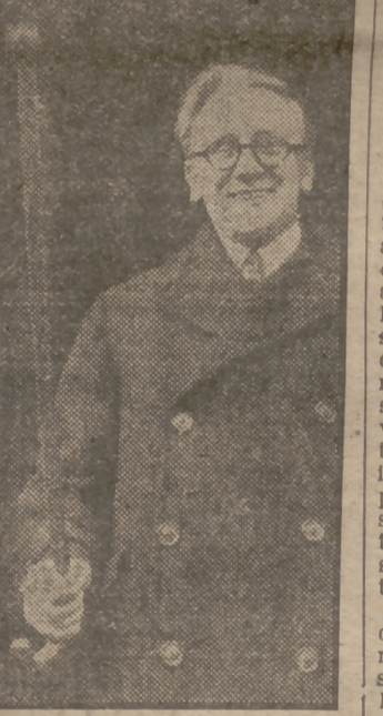
Victima de una trombosis a la pierna izquierda, ha permanecido enfermo durante mucho tiempo en un hospital Mr. Herbert Morrison. Al fin, totalmente curado, ha abandonado el establecimiento sanitario... y el bastón ortopédico. Ahora volverá a ocupar su puesto de líder parlamentario en la Cámara de los Comunes.