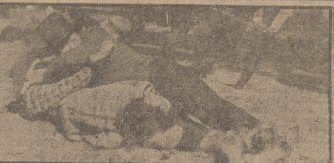
He aquí una escena de la emocionante película "Los jinetes de la muerte", film dividido en dos jornadas que en breve será presentado por Confisa.

A un elevado importe que supera en mucho el millón de dólares alcanza la realización de la película titulada "Los jinetes de la muerte", no sólo por el cuidado exquisito que ha tenido a fin de que las escenas alcancen un absoluto realismo, sino porque en dicha película se ha reunido una extraordinaria cantidad de primeras figuras, artistas todos muy caros, especializados en esta clase de films. Aparte de los principales personajes se han empleado más de un centenar de extras equipados todos de pies a cabeza con el más absoluto realismo, que han elevado el cos-