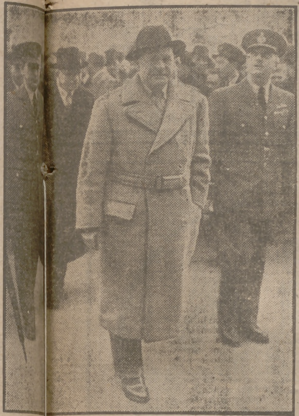
Lord Winterton, llegado a Londres en avión procedente de Nueva Delhi. Northolt fué recibido por lord Pethick Lawrence, Mr.... y miembros de su familia.