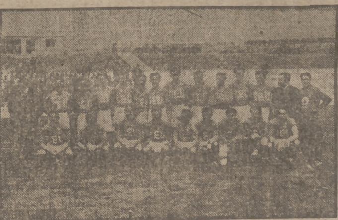
Se jugó ayer mañana en los campos deportivos de la Ciudad Universitaria madrileña el encuentro internacional de rugby entre el S. E. U. de Madrid y el Benfica de Lisboa. La superioridad de los universitarios madrileños está reflejada en el resultado del encuentro 18 a 0 a su favor. He aquí al "quince" español antes del partido.