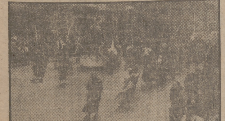
Solemne procesión de las Palmas, que desfiló por las calles céntricas de Madrid ayer, Domingo de Ramos.