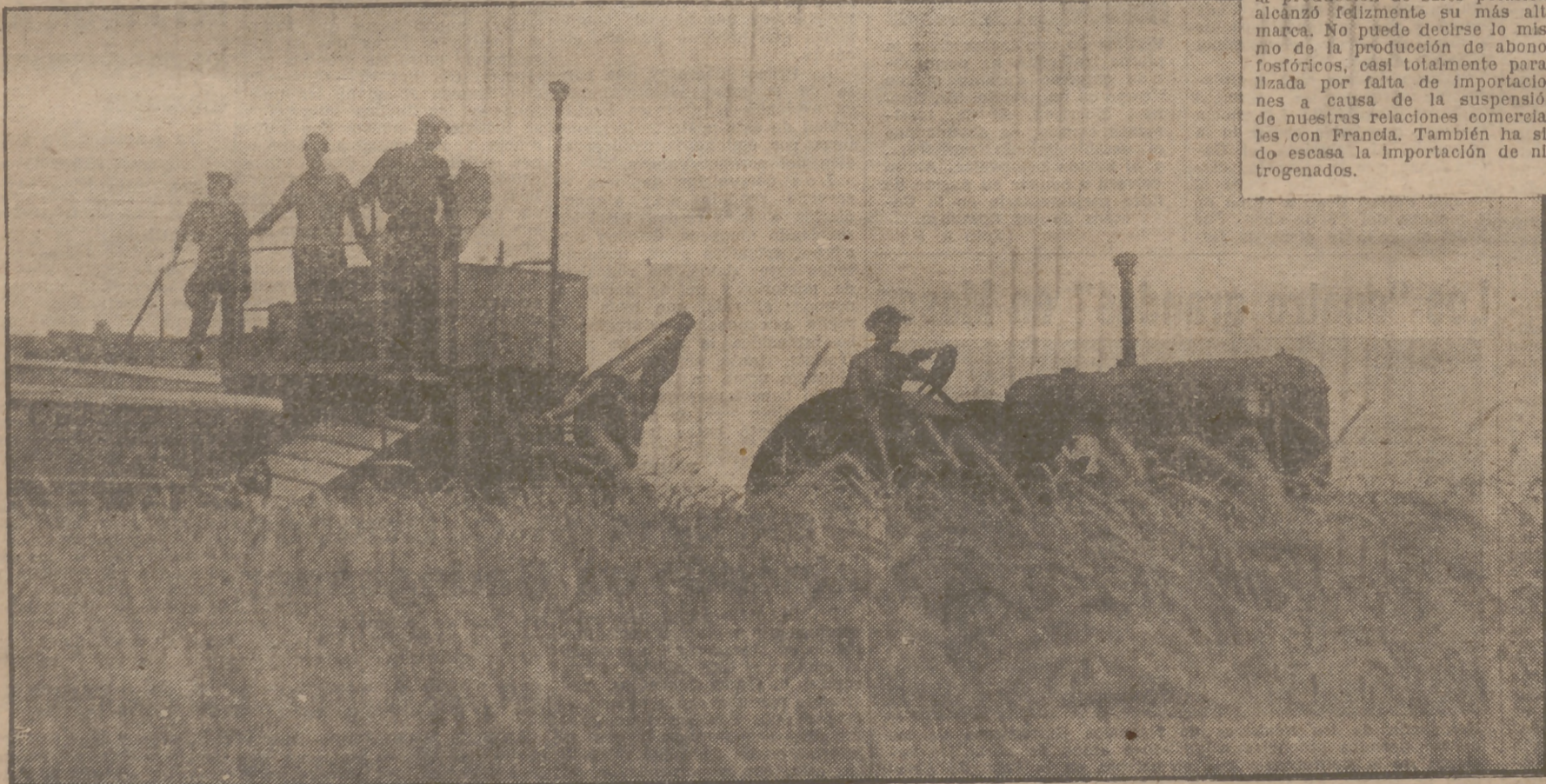
TIERRAS FERTILIZADAS, TIERRAS UBERRIMAS

La aplicación de abonos nitrógenados produce rendimientos magníficos, consiguiéndose con el mismo trabajo aumentar la producción del terreno, siendo evidente que si en España dispusiéramos de la cantidad necesaria de sulfato amónico, nitrato sódico o de Chile, nitrato amónico y superfosfatos, el problema de suministrar alimentos a todos los españoles quedaría resuelto en su totalidad, aunque, naturalmente, para ello sería necesario que el agricultor dispusiera además de los abonos, de los medios de tracción mecánica o animal, imprescindibles para las labores agrícolas. Como ejemplo podemos citar que la aplicación de un kilo de sulfato amónico al cultivo de arroz produce un aumento de 10 kilos del citado grano en la cosecha, y aplicándolo a la patata, se obtiene un aumento incluso mayor, consiguiéndose esos tubérculos excepcionalmente voluminosos, que recientemente han causado admiración entre los españoles que han tenido la suerte de observar de cerca algún ejemplar de las patatas de importación norteamericanas, hace poco llegadas a nuestra Patria.