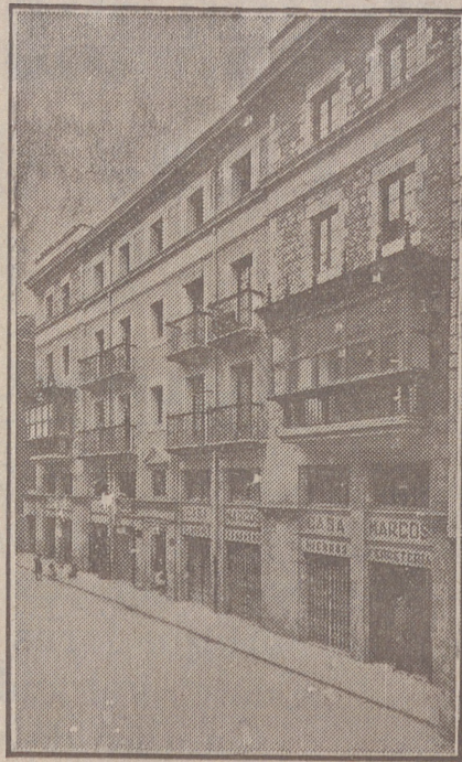
Fachada, por la calle de la Moneda, números 15 y 17, de la CASA SOCIAL propiedad de la Federación Burgalesa de Sindicatos Agrícolas Católicos.

Se hallan establecidas en su planta baja las Oficinas y talleres de máquinas de «El Castellano» y «El Defensor de los Labradores»