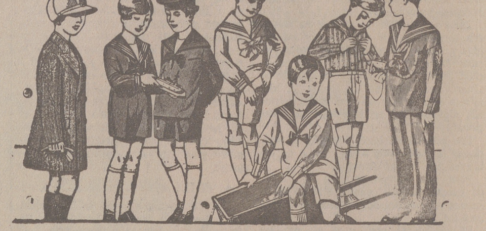
50 modelos distintos en trajes para niños en dril, en pana, en paño y en jergas azules, de 10 a 40 pesetas.

Primera casa en confecciones para caballero, señora, jóvenes y niños. — Tejidos, Pañería y Sastrería.