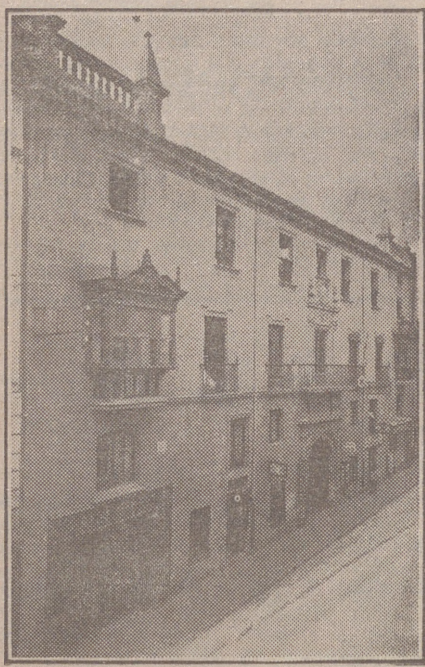
Fachada, por la calle de Santander, 10, 12 y 14, de la CASA SOCIAL propiedad de la Federación burgalesa de Sindicatos Agrícolas Católicos.

En ella están las Oficinas de la FEDERACIÓN, CAJA DE AHORROS, MUTUALIDAD AGRÍCOLA BURGALESA y Redacción y administración de «El Castellano» y «El Defensor de los Labradores».