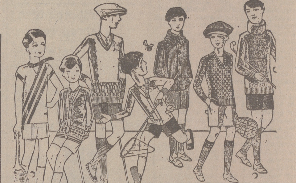
Jerseys para niños, dibujos novedad, desde 4, 4,5, 5, 6, 7, 8, 10 y 12 ptas. Siempre gran surtido para elegir.