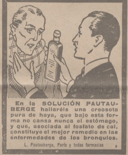
En la SOLUCIÓN PAUTAU-BERGE hallaréis una creosota pura de haya, que bajo esta forma no cansa nunca el estómago, y que, asociada al fosfato de cal, constituye el mejor remedio en las enfermedades de los bronquios.