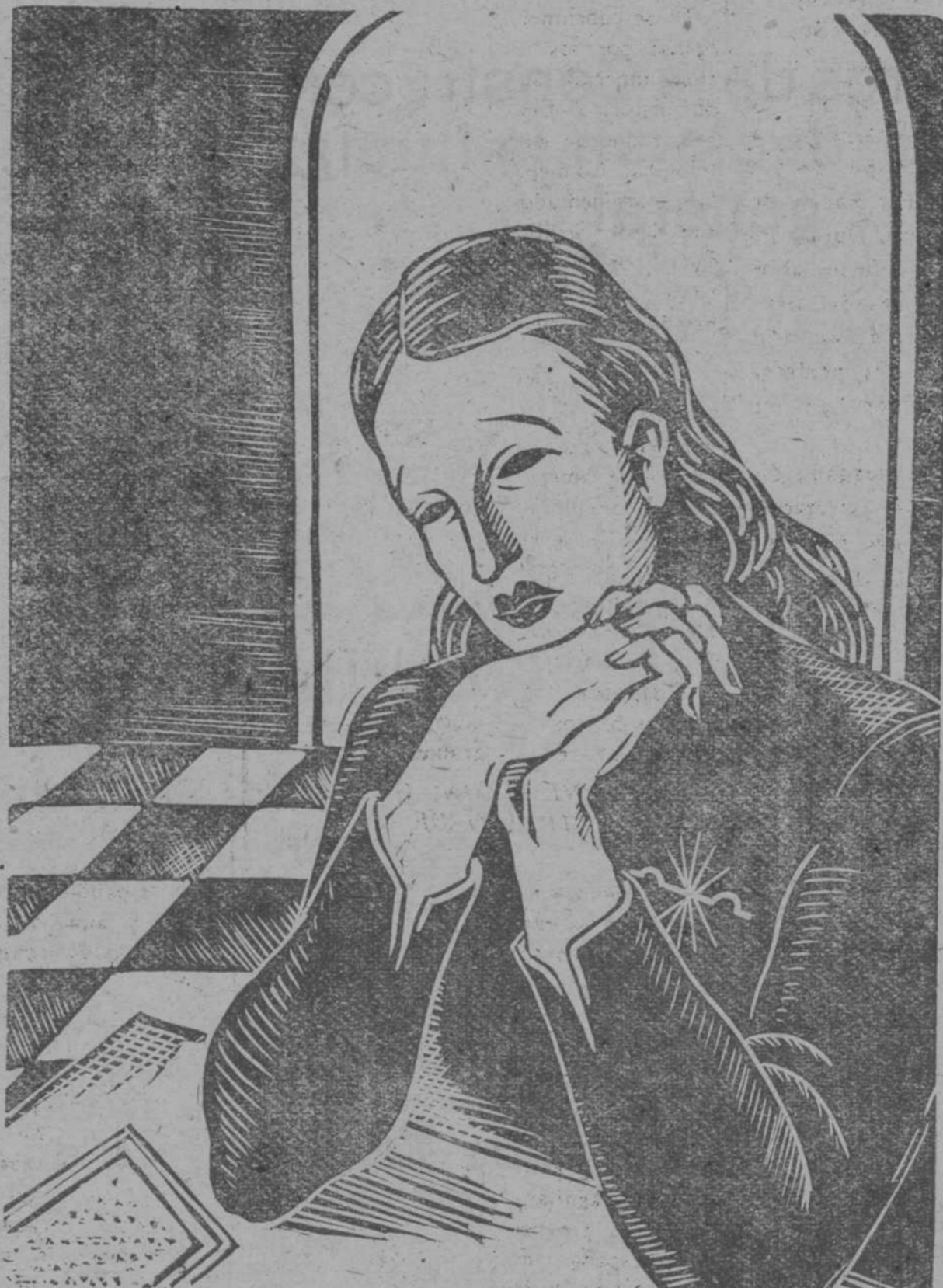
Linóleo de BEBERIDE

Tu novia ya no se llama la novia de dos colores, color de gloria en la luz, color de sombra en la noche. Tu novia se llama ya María de los Dolores con el corazón cruzado por siete golpes temblores. Tu novia quiere dormir