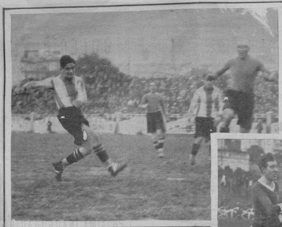
Un chut de Ventoldrà..