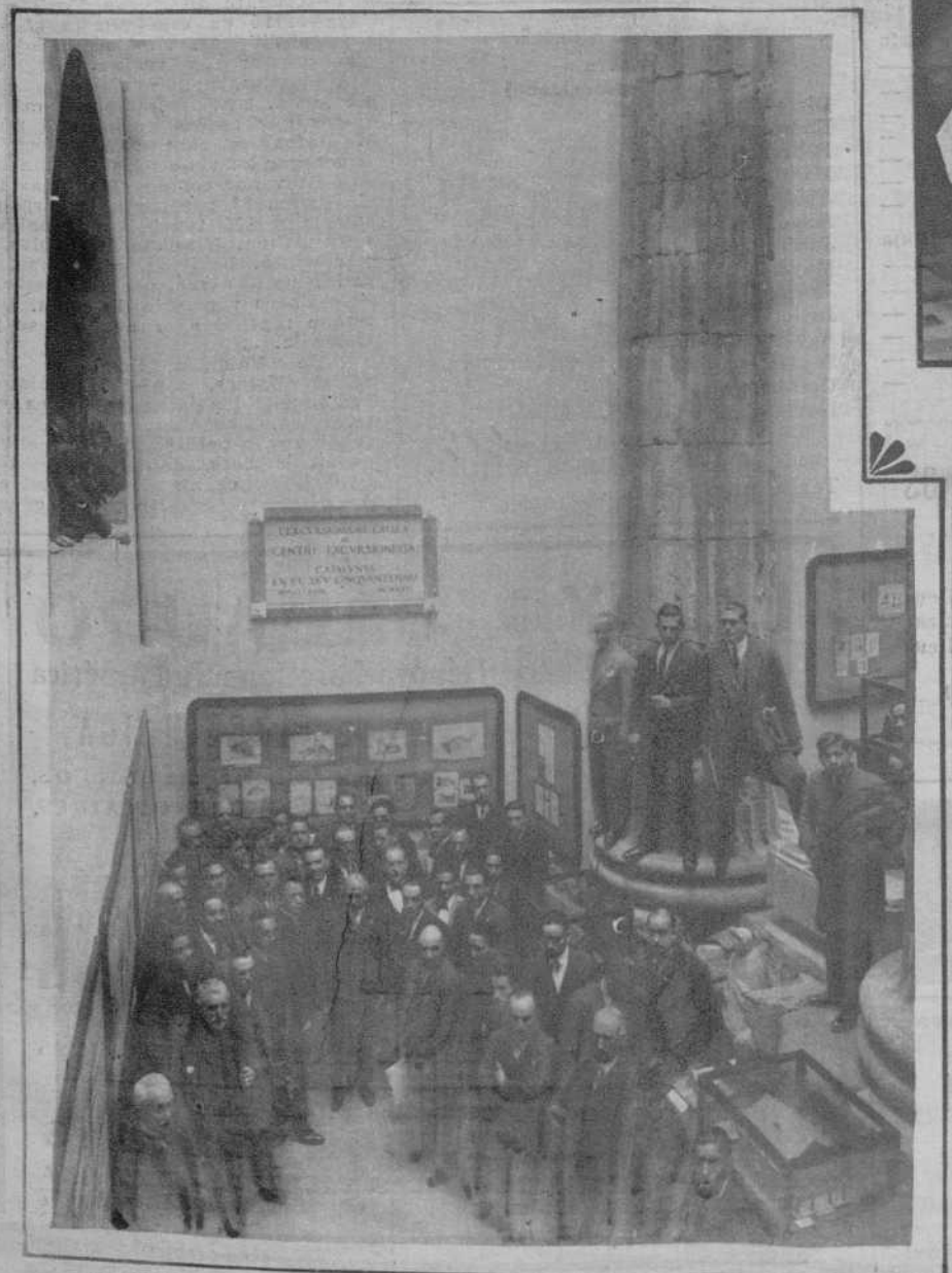
BARCELONA.—Descubrimiento de la lápida conmemorativa del cincuentenario de la fundación del «Centre Excursionista de Catalunya». (Fot. Badosa).