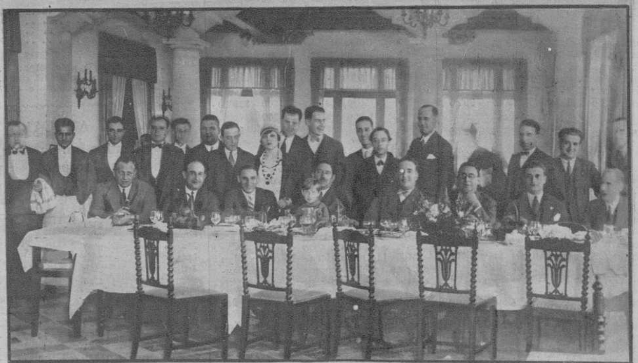
BARCELONA.—Comida íntima que, como agasajo al famoso torero Vicente Barrera, celebraron varios de sus amigos y la Empresa de la Plaza de Barcelona en el Restaurant de moda FONT DEL LLEÓ. (Fot. Mateo).