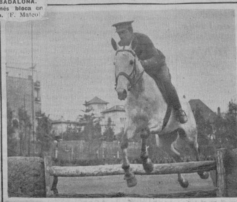
8 y 9: Dos aspectos del concurso hipico celebrado en el R. P. J. C. entre los regimientos de caballeria. (Fotos Maymó).