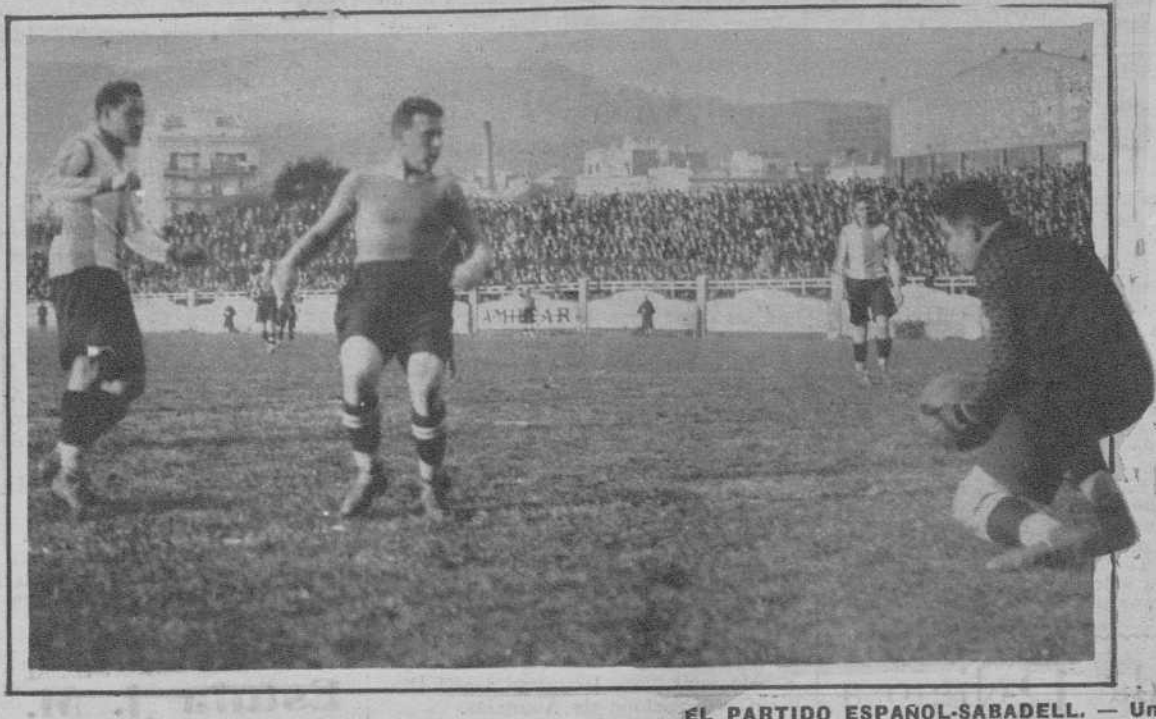
EL PARTIDO ESPAÑOL-SABADELL. — Un chut detenido por el guardameta sabadellense.