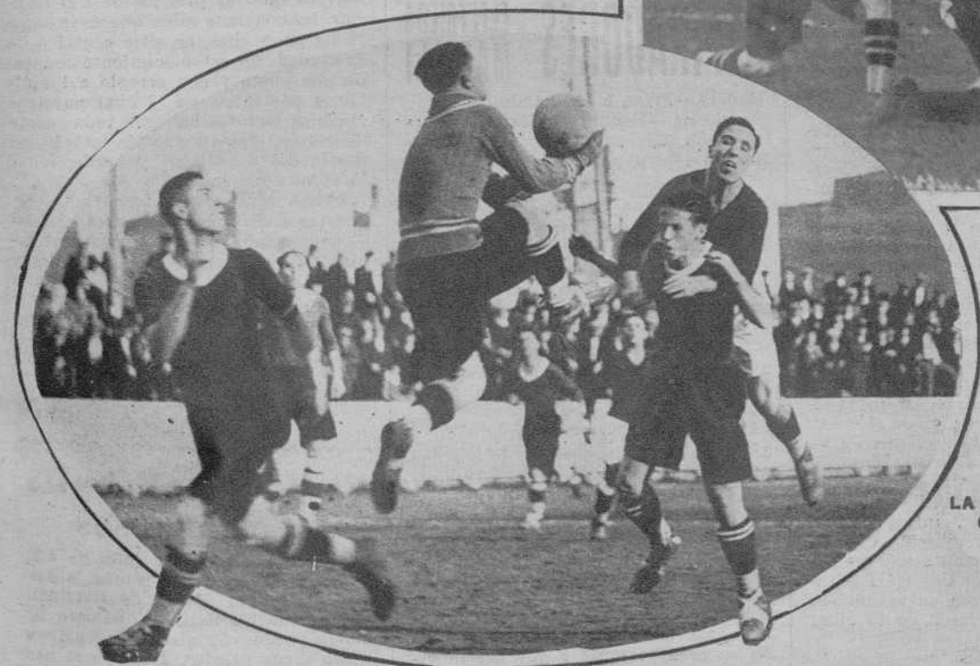
EL PARTIDO GRACIA-BADALONA. El guardameta badalonés bloca en un momento de peligro.