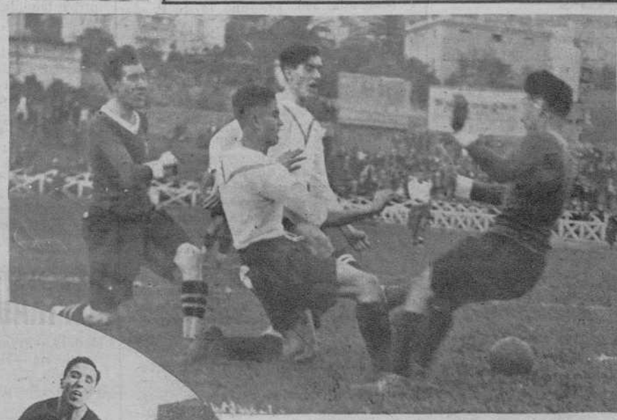
EL PARTIDO EUROPA-TERRASSA. — Una situación de peligro para la meta tarra-sense.