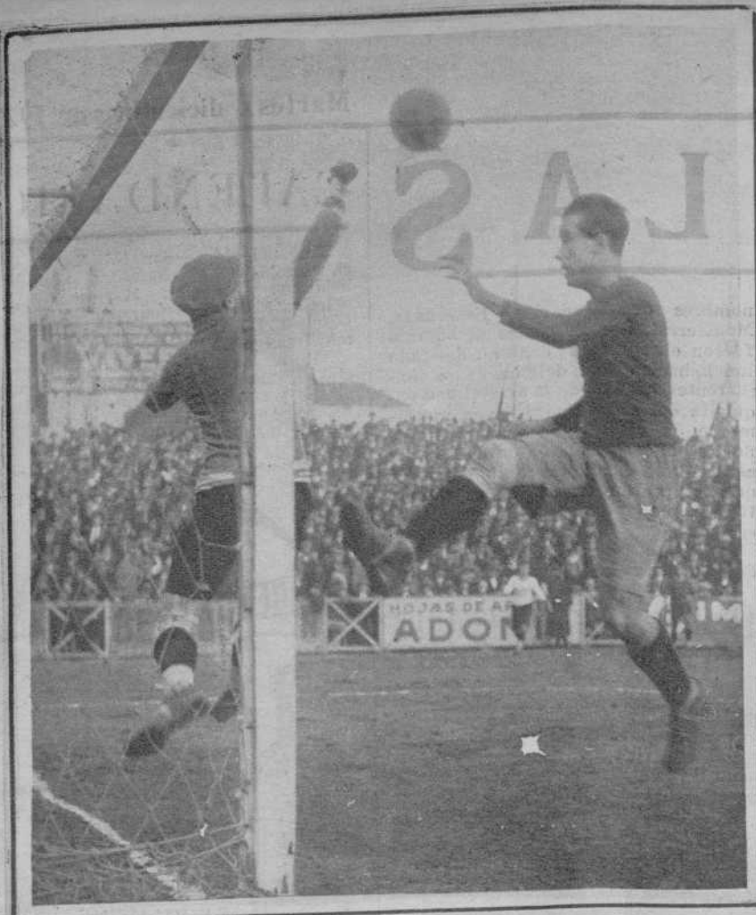
PARTIDO SANS-BARCELONA. —Un despeje del guardameta sansense.