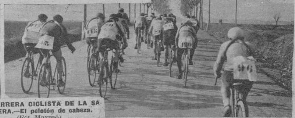
LA CARRERA CICLISTA DE LA SAGRERA. —El pelotón de cabeza..