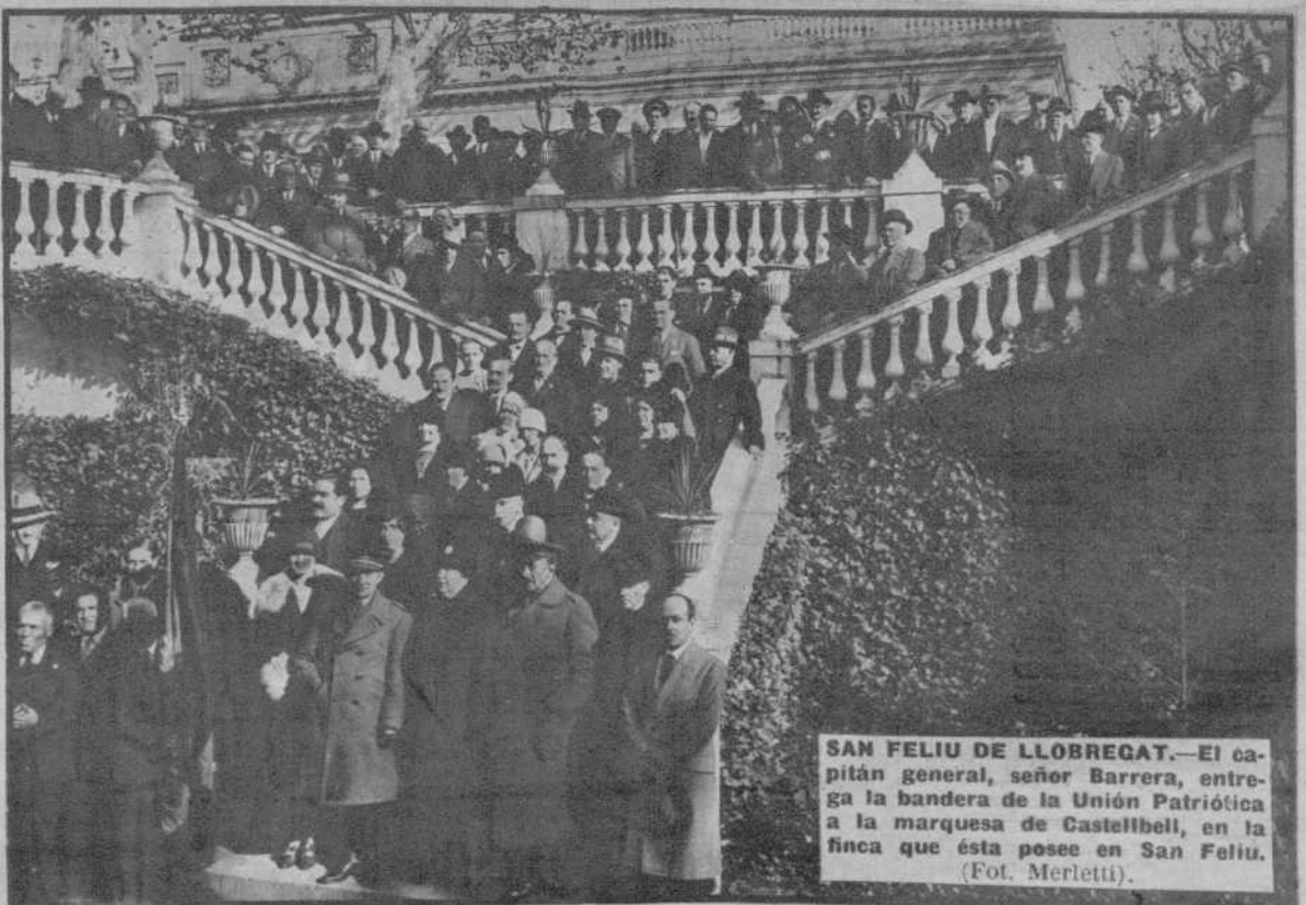
SAN FELIU DE LLOBREGAT.—El capitán general, señor Barrera, entrega la bandera de la Unión Patriótica a la marquesa de Castellbell, en la finca que ésta posee en San Feliu.