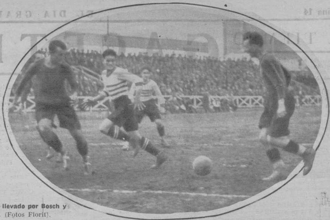
Un avance llevado por Bosch y Carulla.