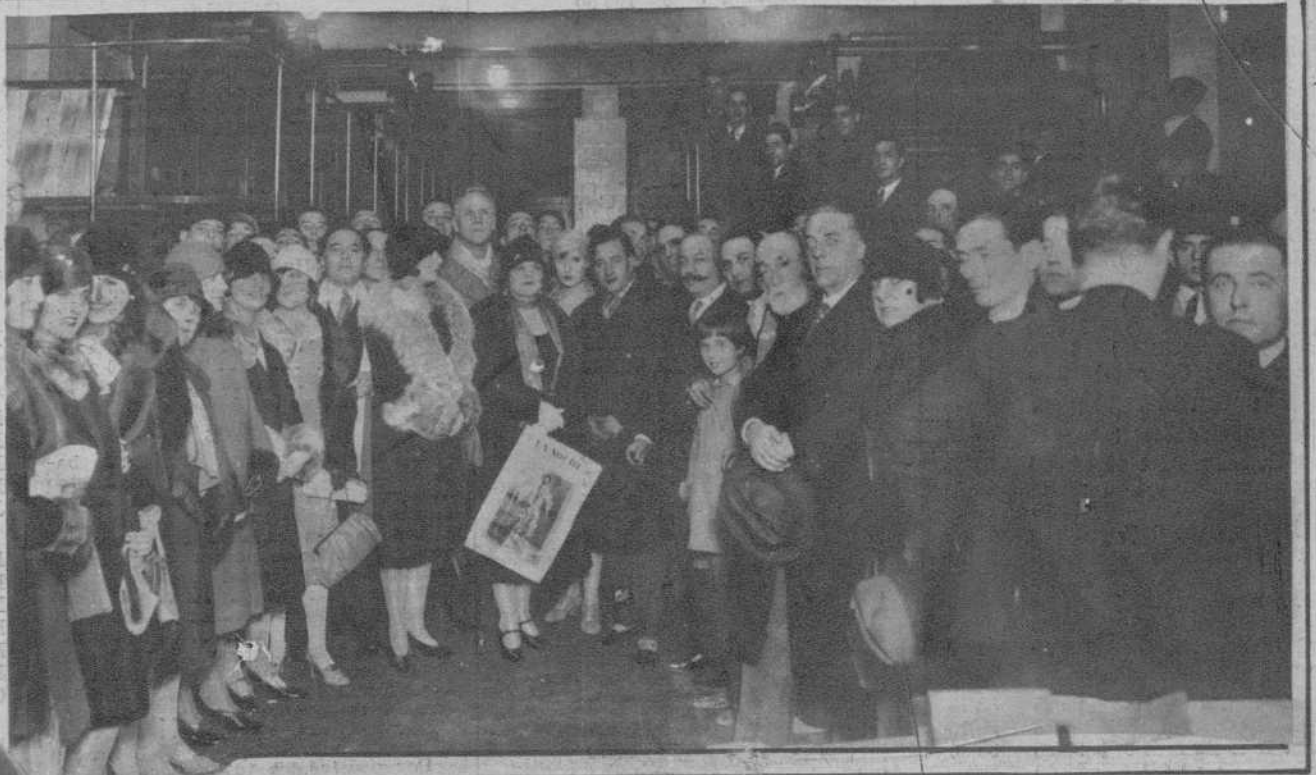
BARCELONA.—Los eminentes artistas Fleta y Chaliapine, junto con otros notables cantantes del Gran Teatro del Liceo, en su visita a nuestros talleres.