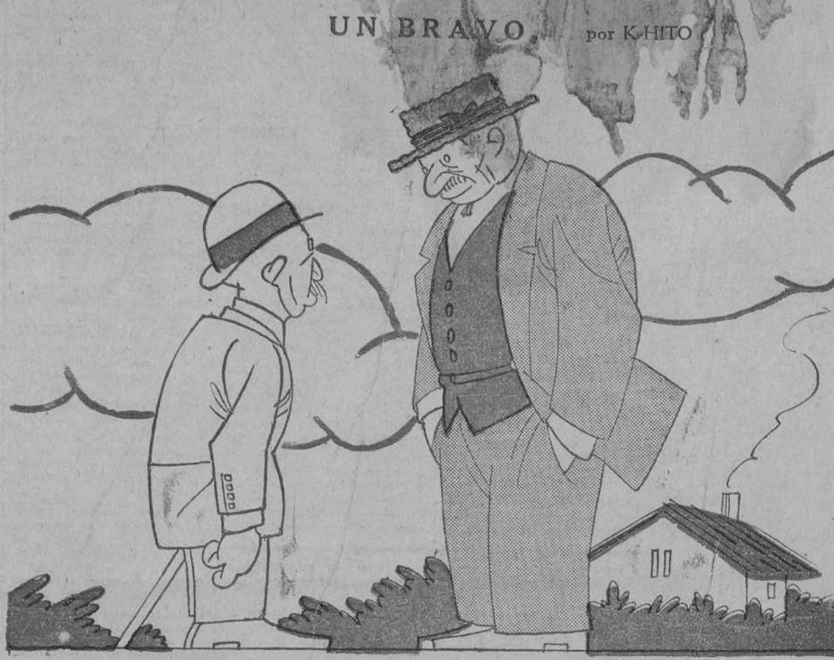
EL PEQUEÑO.—¿Es verdad que habla usted mal de mí? —Sí, señor; es verdad. —¡Ah! Porque si hubiese sido mentira nos veríamos las caras.

Alí está, para demostrarlo, el segundo... caso. Schreiber, el que se escondió a bor-... do del "Pájaro Amarillo" para hacer de