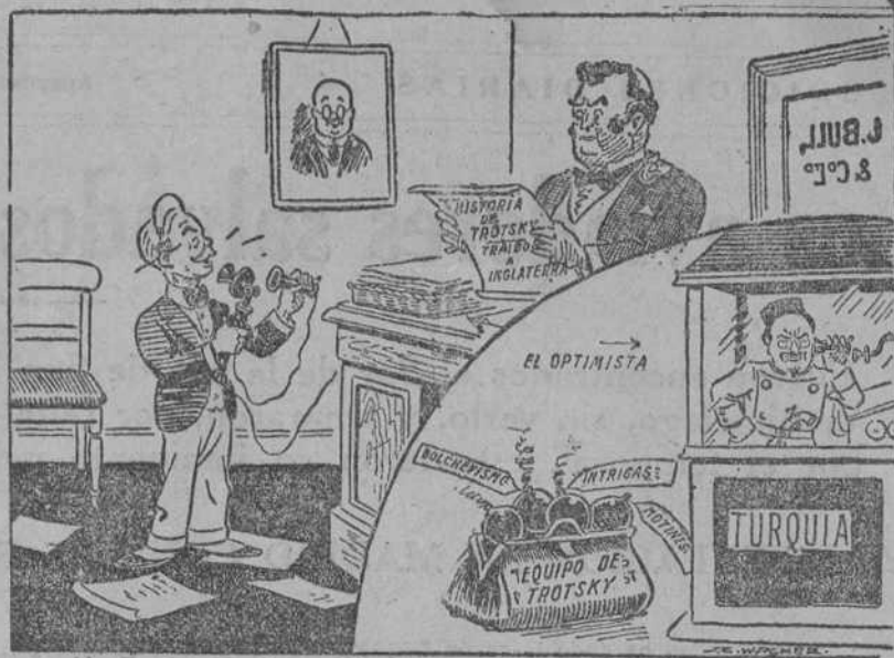
CLYNES (ministro del Interior).—Una persona llamada Trotski al aparato. Dice que si puede venir, que lo necesita para su salud.