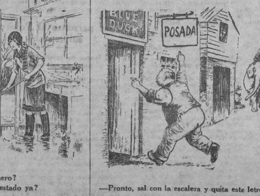
LOS SIETE TRABAJOS DE HERCULES-HOOVER