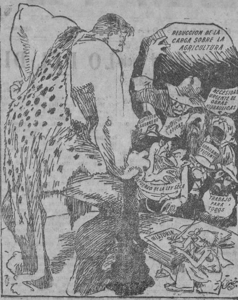
LOS SIETE TRABAJOS DE HERCULES-HOOVER