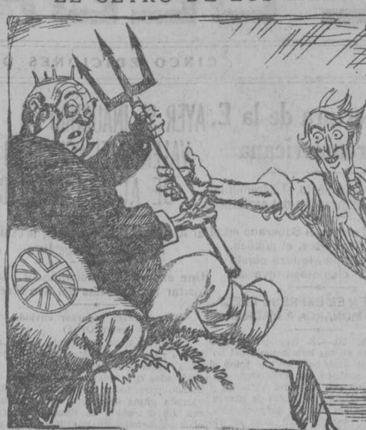
EL TIO SAM.—Padre, dame el tridente, que se ha hecho demasiado pesado para tu brazo.