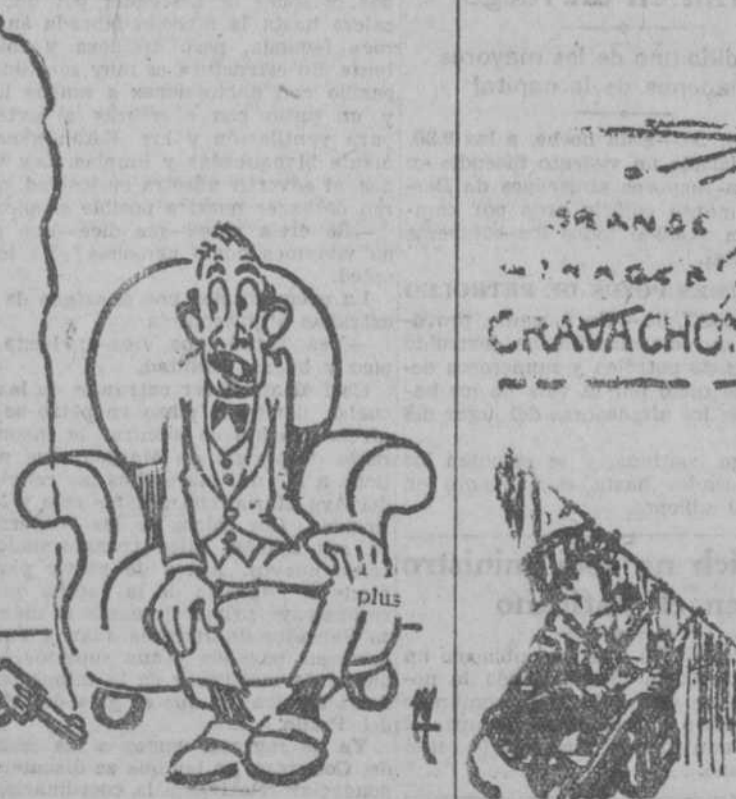
PRECAUCION No te quejarás, papá. He disparado lo más dulcemente posible mientras tú dormías.