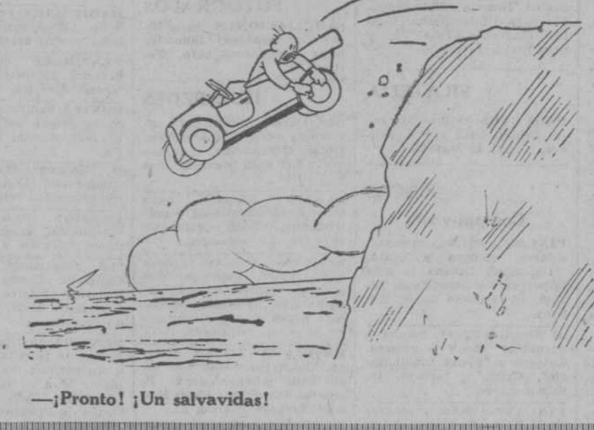
¡Pronto! ¡Un salvavidas!