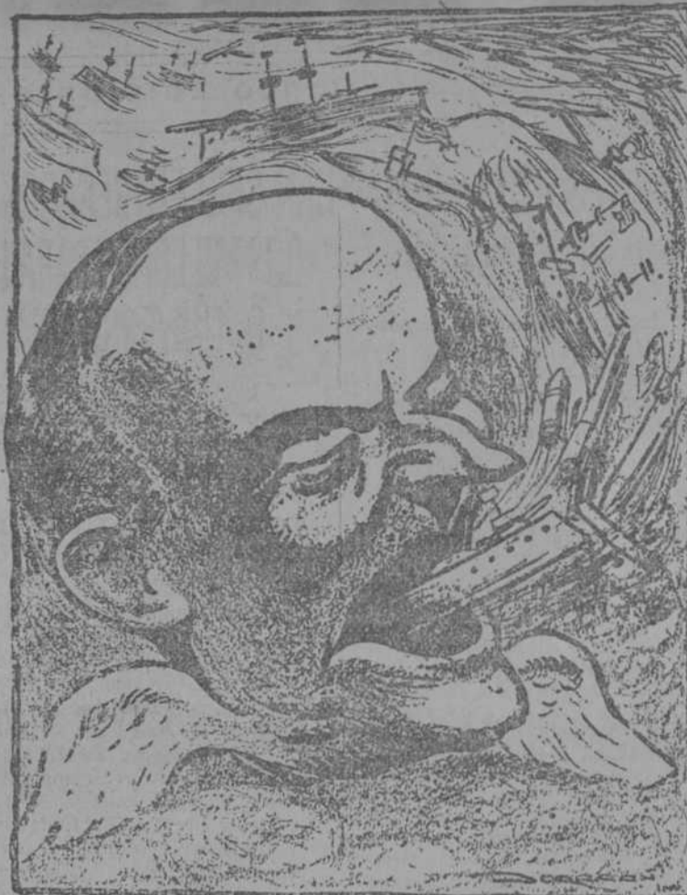
EL PRESIDENTE COOLIDGE HABLA DE PAZ