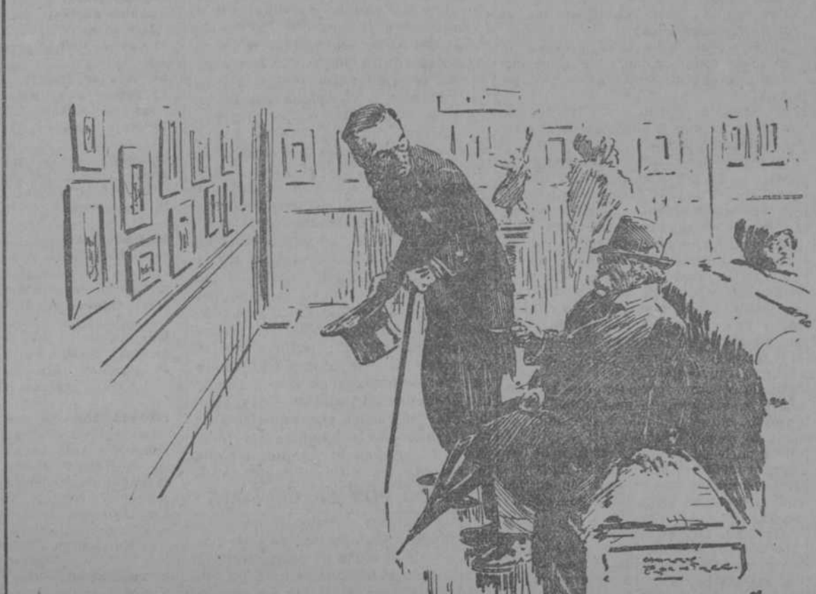
(Passing Show, Londres.)

—A mí no me interesan los cuadros pequeños. Sólo me gustan los lienzos grandes. —¿Es usted artista? —No... Soy fabricante de lienzos.