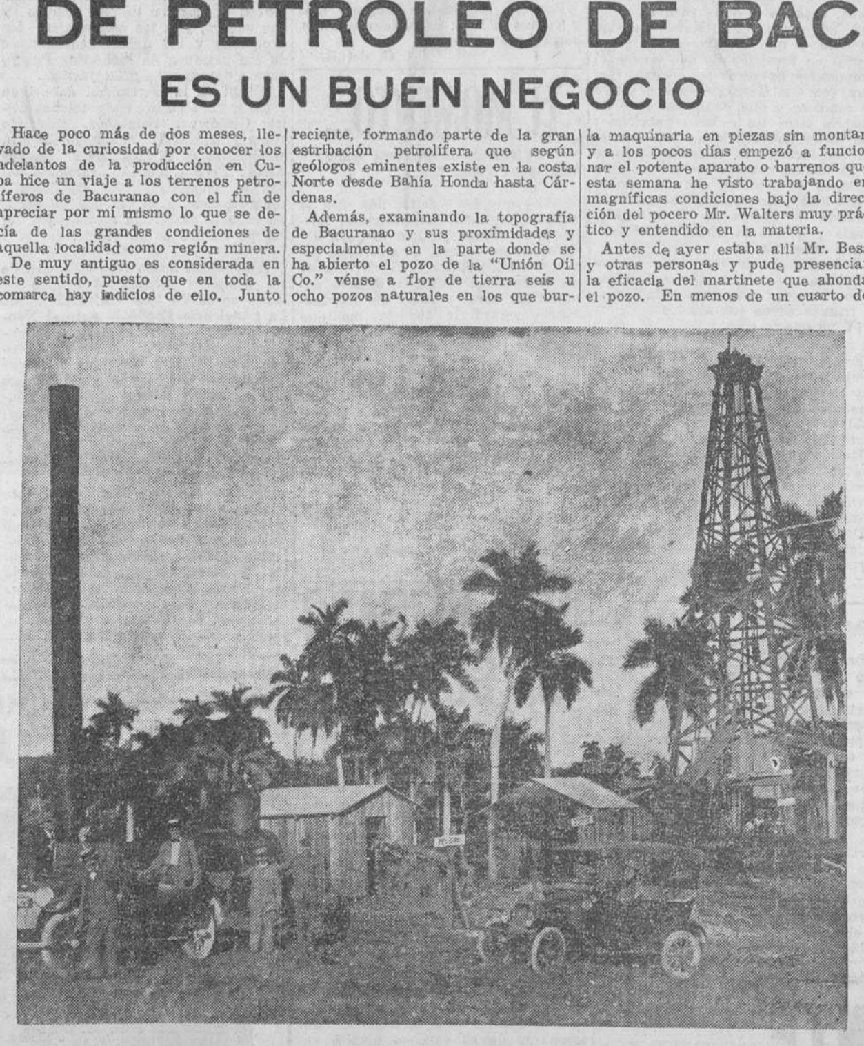
ASPECTO GENERAL DE LA MINA DE PETROLEO DE BACURANAO Y SU POTENTE MAQUINARIA

de la 12a Estación se constituyó en la Casa de Socorro levantando acta de lo ocurrido, dándose cuenta al Juzgado de Instrucción de la Tercera Sección.