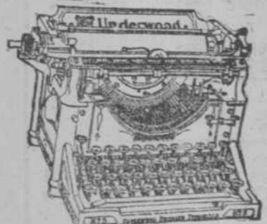
EL SETENTA POR CIENTO

O'Reilly 16 moderno Teléfono 4-7806 C 3534 13-Oct.