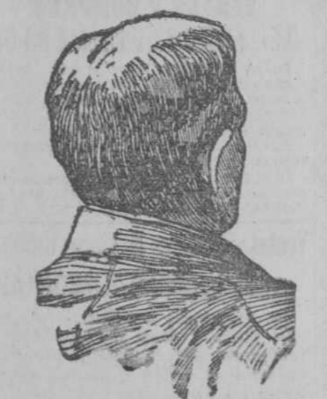
C 3711 alt. 4-3