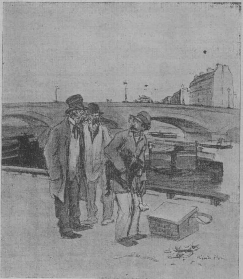
—Perdón; yo soy partidario de la igualdad. Ustedes tienen que esperar su turno correspondiente.