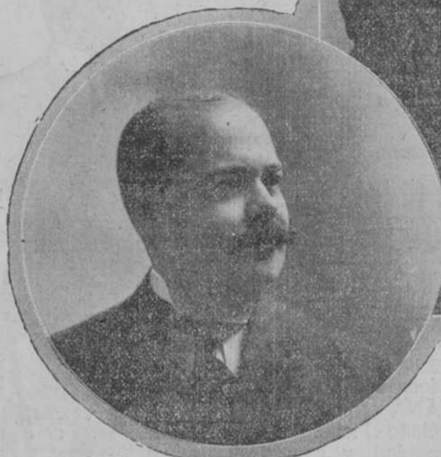
ERNESTO ASBERT, para Gobernador Provincial de la Habana.

Triunfaron los liberales en las elecciones por una mayoría de 222 votos. A consecuencia de coacciones y amenazas constantes, hubo numerosos retraimientos. Las elecciones se celebraron con orden. El servicio de