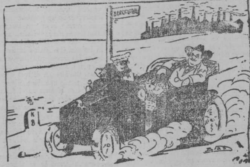
—¿Perdón; yo soy partidario de la igualdad. Ustedes tienen que esperar su turno correspondiente. —¿Cómo si no se pudiese viajar más que en ferrocarril! (El Correo Español, de Madrid.)