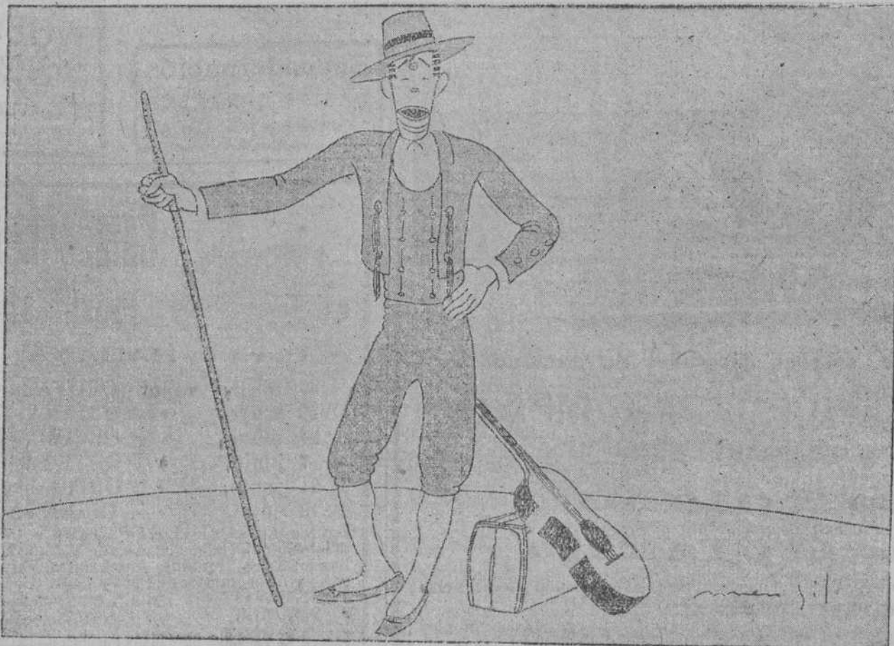
«MIRAME, PALOMA MIA...» MIRAME Y PIDE AL «ARCARDE» QUE A LOS TRAJES DE PASIEGO SE AÑADA UNOS ALAMARES.