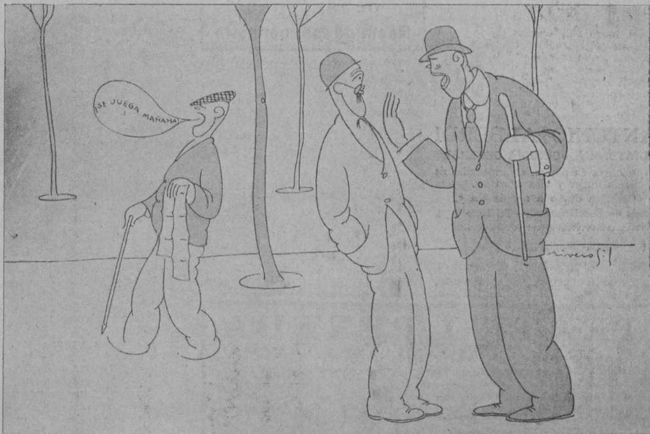
—CREAME USTED. HOY YA NO SE JUEGA EN ESPAÑA.

REBOLLEDO. — CORONAS DE FLORES. — Teléfonos 7-55 y 7-56.