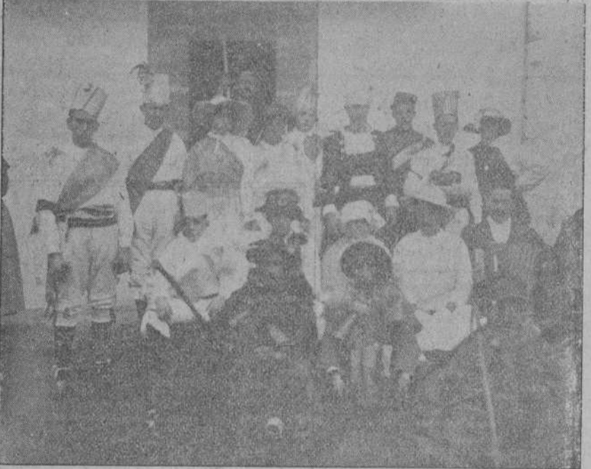
LAS «VIJENERAS» DE BARCENA Y ALCEDA, QUE HAN CIRCULADO ESTE AÑO.

...y unas cuales, si falta la «vijenera» parece que el año ha terminado antes de tiempo. La gente moza añora el monótono cerceceo de los «zarramacos» — «za marrones» les dicen en Toranzo, claro está que con permiso de los ilustres montaÑesistas— y en sus manos mueren de contrariedad las monedas de cobre que estaban destinadas al «tiu del osu» y al postulante de la comparsa. Porque, eso sí, la «vijenera» consiste en una, dos, tres, veinte comparsas; pero comparsas a palo seco sin esa variedad del mal gusto que ha venido a dar con sus huesos la carnavalesca oficial. Hay el oso que baila y bebe vino y se pone hecho una lástima de barro y hasta pesca un constipado de cien caras de estornudos; una pareja de viejos—delirio de chicos y alborozo de maveres—y el «zarramaco» campanero; pero, vamos, estos tipos son tan componentes de la comparsa como el paisano que al frente de las máscaras dirige las evoluciones y toca el acordeón. La «vijenera» no tiene otra finalidad que despedir al viejo-Enero y de paso, bailar algo y recaudar lo que buenamente se pueda. Han desaparecido las características figuras de la «madame», la «pepa», el «indiano» y el «emargatín»; subsiste, como queda dicho, el oso bailarín y se ha enriquecido la comparsa con una grave pareja de pasiegos, que ponen sus cinco sentidos en el baile y de cuando en cuando