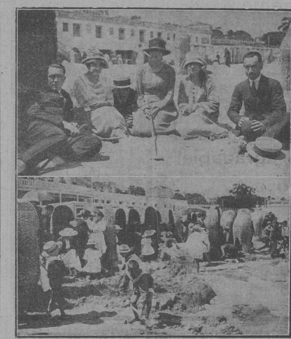
ESCENAS DE LA PLAYA