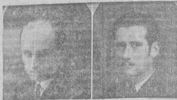
CALVO 13 AÑOS