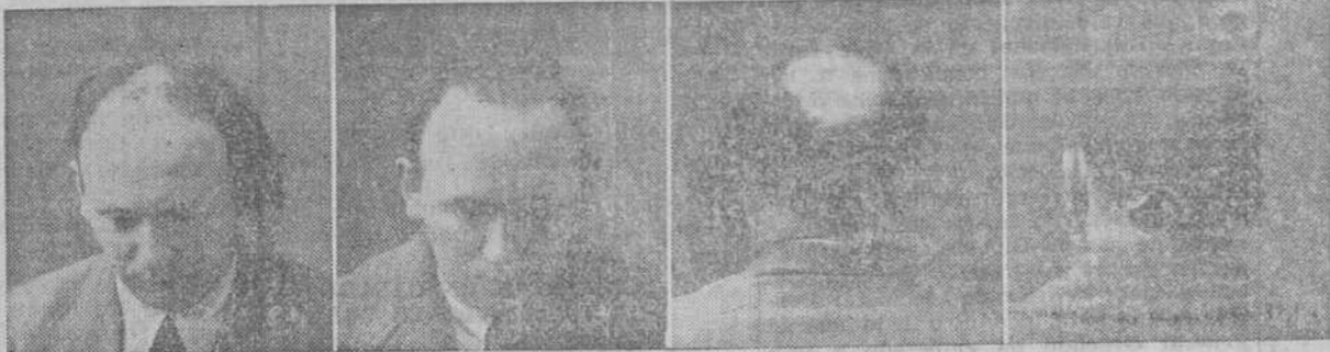
CALVO 10 AÑOS

65.000 cartas afirman la eficacia, 150.000 casos curados en el mundo entero, reconocidos por las autoridades españolas y extranjeras. El inventor del CAPILAR J. MOURADE, universalmente conocido por sus maravillosas curas (muy conocido en España por haber curado una infinidad de casos rebeldes de calvicie), estará los días 12, 13 y 14 en esta ciudad, en el HOTEL MEXICO, donde recibirá las consultas de los interesados en su maravilloso específico, exponiendo los casos curados después de treinta años de calvicie.