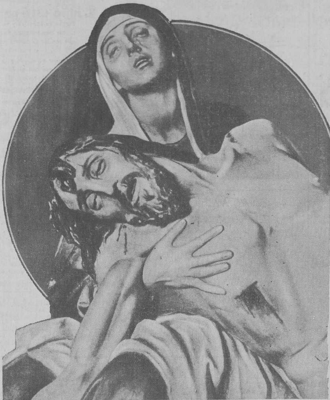
NUEVAS ESCULTURAS SACRAS.—Fragmento de «La Piedad», que forma parte de un grupo escultórico policromado debido al cincel del insigne Aniceto Marinas.