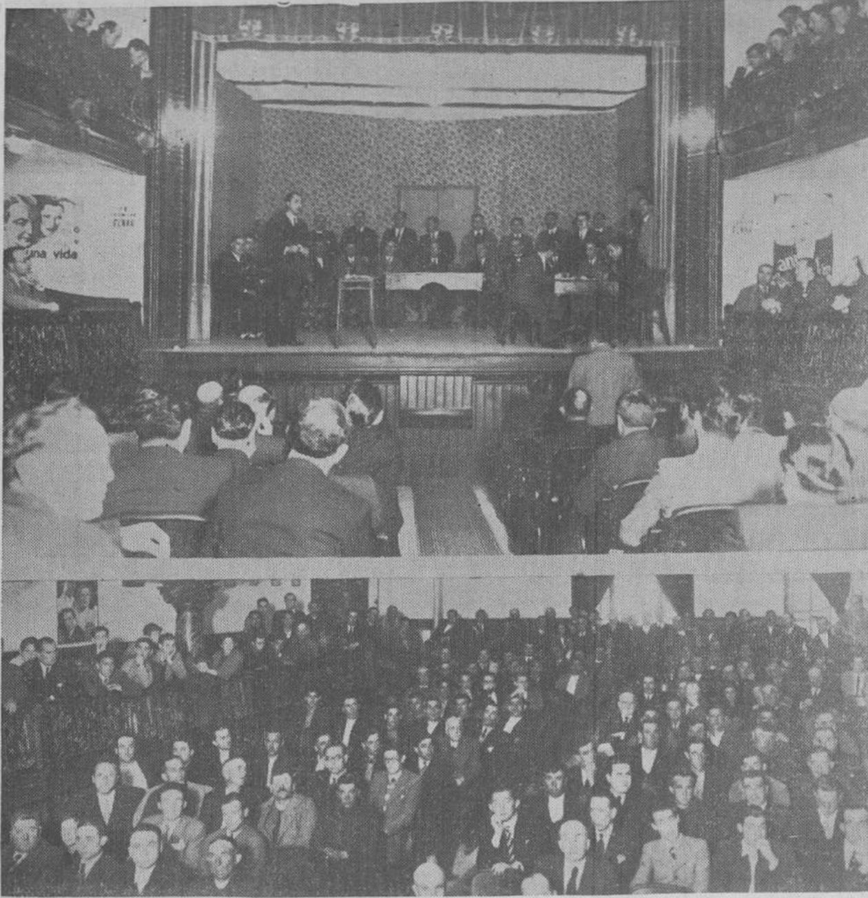
Dos aspectos de la importante Asamblea celebrada ayer en Santoña por los pescadores del litoral y con asistencia de las autoridades.

A la terminación del acto de la mañana, que tuvo lugar en el Casino, dirigió unas palabras de saludo el señor gobernador de Santander, ofreciéndose a laborar decididamente en pro de estas legítimas aspiraciones de los pescadores del