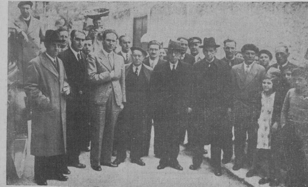
El gobernador civil de Santander; los alcaldes de Santoña, Santander y Bilbao; el presidente de la Diputación de Santander y representantes de Guipúzcoa, al salir de la importante Asamblea pesquera celebrada ayer en Santoña.

Un film de maravilla. Una historia de amor. Emoción, Intriga y aventuras. Temibles maquinaciones. Adaptación cinematográfica de la inmortal obra del mismo título, original de Eugenio Sue.