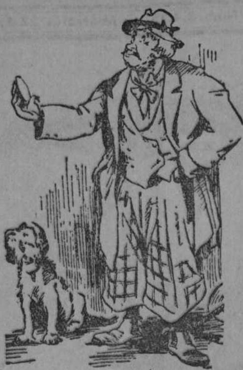
No lo comprendo. Tengo el sombrero de un financiero, el traje de un banquero, el pantalón de un rentista, las botas de un coronel y... a pesar de todo, ¡sigo pareciendo un vagabundo!