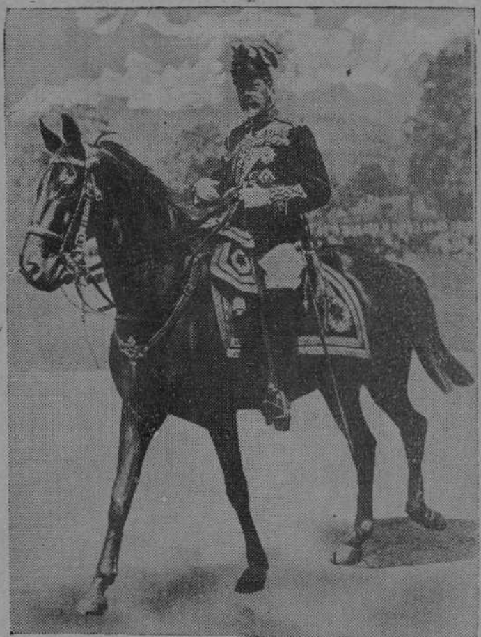
Jorge V, durante una gran revista militar.

La Corte inglesa, desde el establecimiento de la actual dinastía, y más concretamente, desde el reinado de la reina Victoria, no se ha parecido a ninguna de las demás Cortes europeas. Con todo el esplendor tradicional y mayestático, de que fué una «reina elocuente» el jubileo de este mismo Jorge V, que se celebró el pasado año; con todo lo que ser Rey y Emperador representa en un Imperio tan vasto y tan rico, la primera familia, la familia reinante, vive en un ambiente de modestia y de honestidad de que apenas hay ejemplos entre los poderosos de la tierra. La reina Victoria marcó la pauta. Presidió los tiempos llamados «victorianos», que son casi una civilización. Vivió en fa-