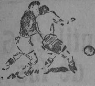
EL ADIOS DE HUGO MEILS, SELECCIONADOR DE AUSTRIA

"Ahora", en su número de hoy, publica un saludo de despedida del seleccionador nacional austriaco al pueblo deportivo español, concebido en los siguientes términos: