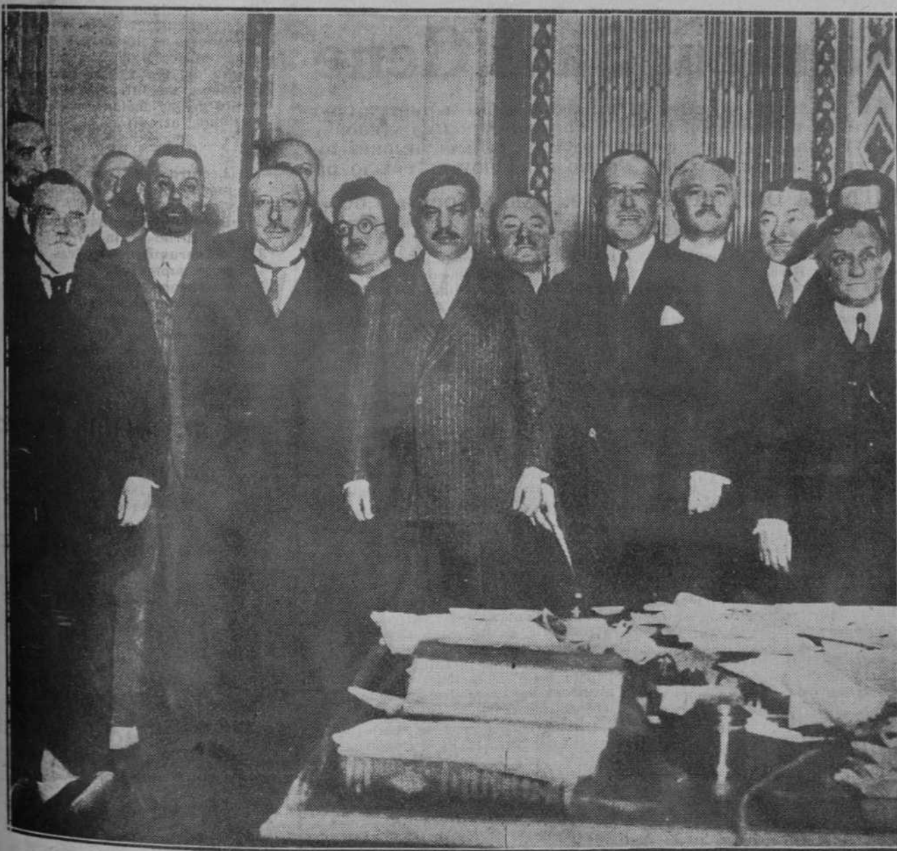
LA ACTUALIDAD EN EL EXTRANJERO.—El jefe del nuevo Gobierno francés, Pierre Laval (en el centro, con traje claro), con los miembros del Gabinete, momentos después de su presentación oficial al Presidente de la República.