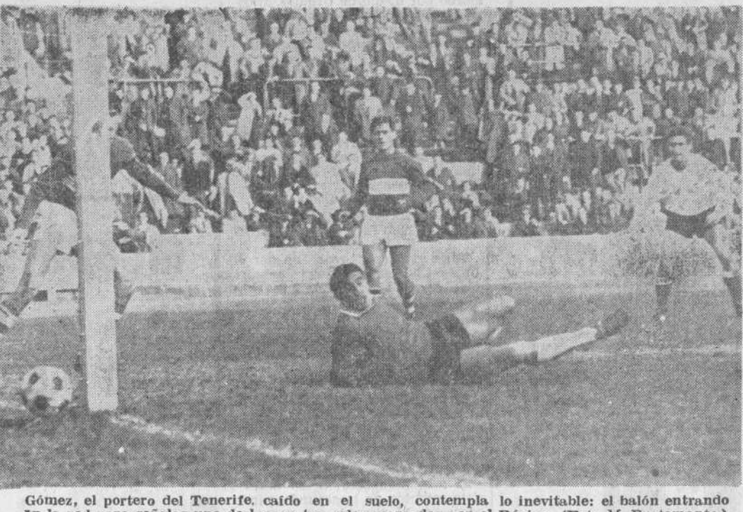
Gómez, el portero del Tenerife, caído en el suelo, contempla en la red para señalar uno de los cuatro goles marcados por el Racing.

Dos penalties, uno por cada equipo, se lanzaron en el partido Crónica de nuestro redactor PEPE