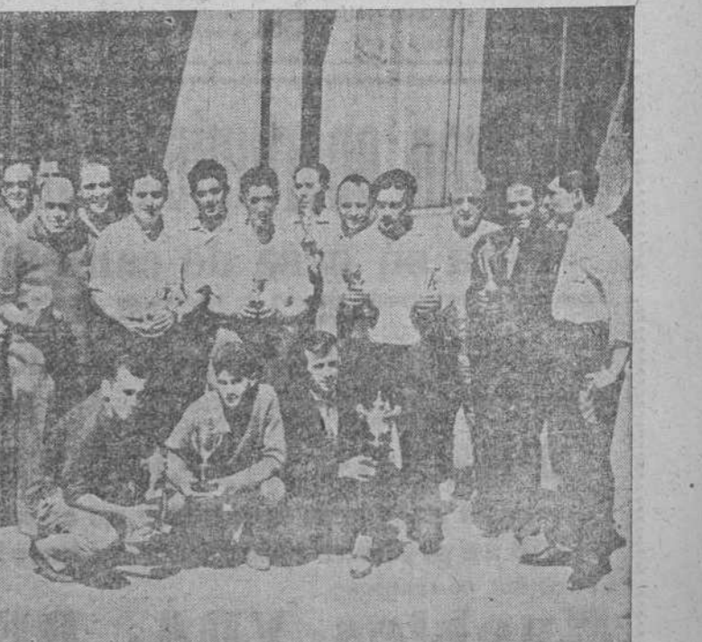
El fútbol playero no está reservado sólo para los "peques". También los mayores, los veteranos, han organizado su campeonato, al que concurrieron muchos equipos, y transcurrió en medio de gran animación. Ayer, en la Casa Sindical se efectuó el reparto de trofeos. He aquí a los representantes de los clubs que participaron en el campeonato, posando para la HOJA DEL LUNES con los trofeos que les correspondieron.