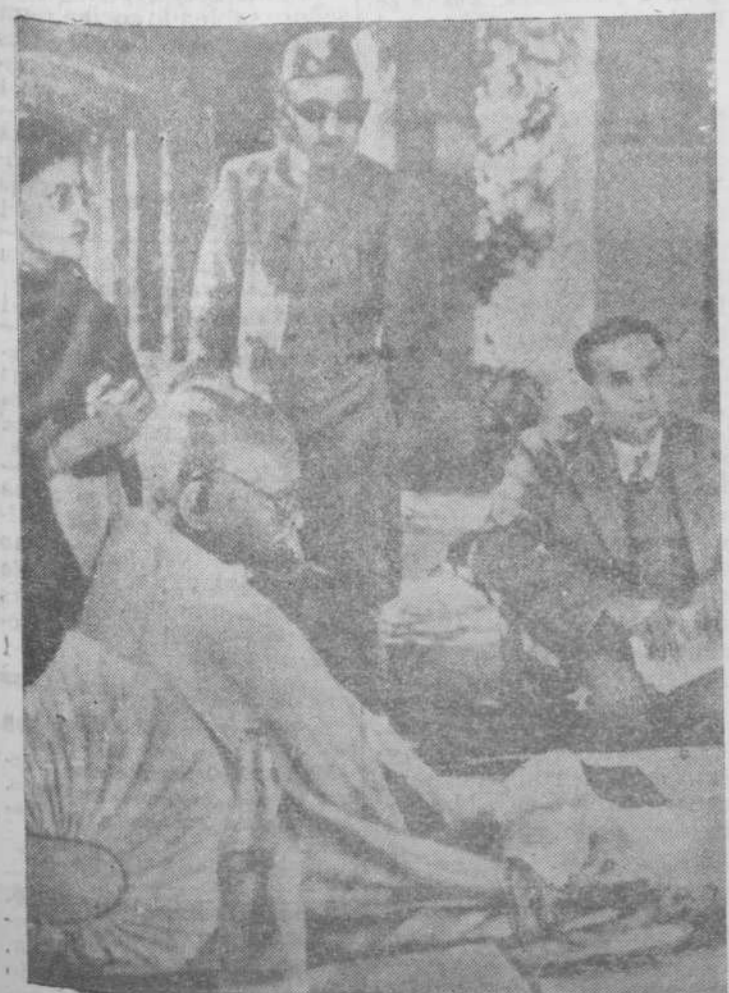
Una de las últimas fotografías del mahatma Gandhi, obtenida durante su reciente ayuno