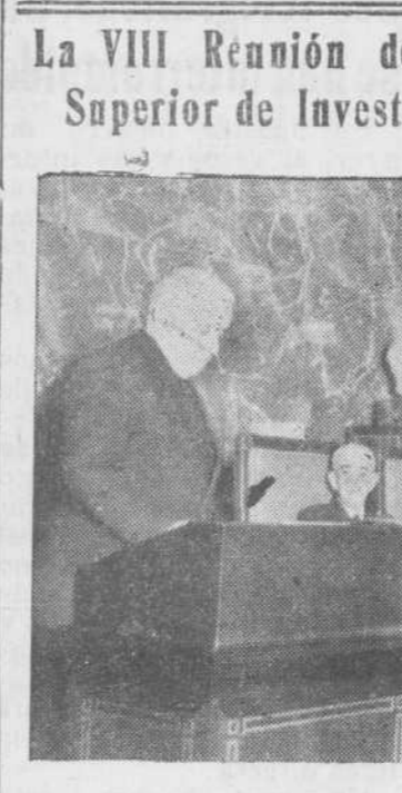
El ministro de Educación Nacional, señor Ibañez Martín, presidiendo el acto con otras ilustres personalidades. En primer término, el director general de Marruecos y Colonias, coronel Díaz Villagas, durante su intervención en el acto.

La VIII Reunión del Pleno del Consejo Superior de Investigaciones Científicas