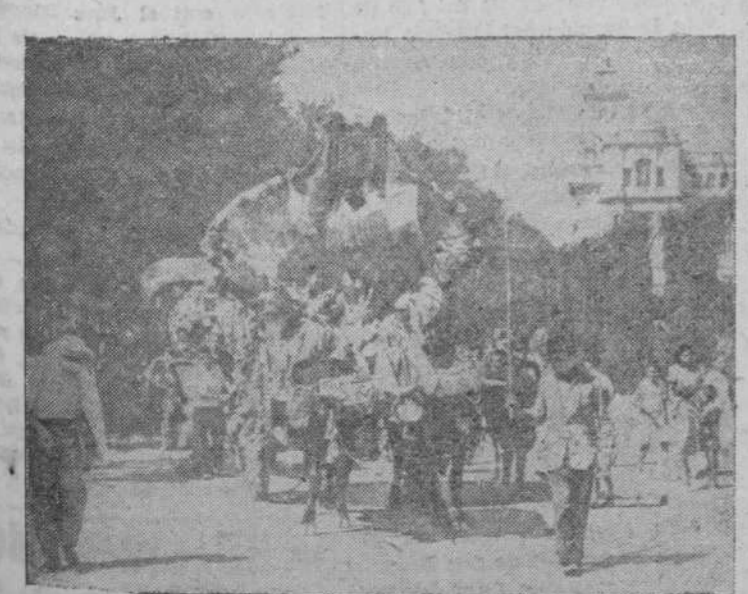
Carrón que obtuvo el primer premio en la tradicional fiesta para de agosto, celebrada con gran brillantez