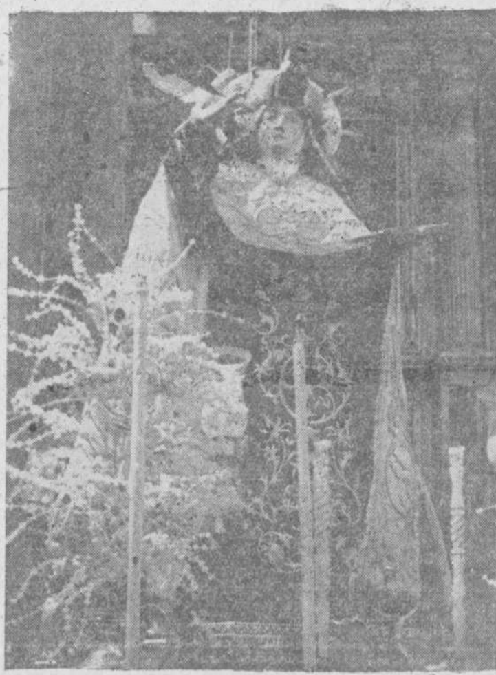
Imagen de Santa Teresa de Jesús, tal y como es expuesta a la veneración, durante las fiestas anuales, en la iglesia de Madres Carmelitas. (Foto Guzmán Gombau).

Y he aquí que, según la misma recopilación de cartas históricas, figura en mencionada publicación y con el número 104 de dichos escritos, el siguiente Breve de S. S. Urbano VIII: "Breve del Papa Urbano VIII declarando el Patronato de Santa Teresa en España.