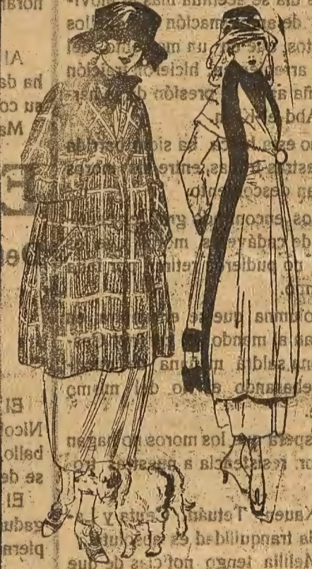
Un año han sido las vestimentas elegantes las puestas en moda, en la temporada las flamencas, el pasado año estuvo en evidencia el esfuerzo y en el presente triunfa la indumentaria española que renaba en la época de la invasión napoleónica.

Se desea hospedaje en Huesca para un viajante. Informará y administrará de este diario, Mercado 12, pral. DIPUTACIÓN DE HUESCA