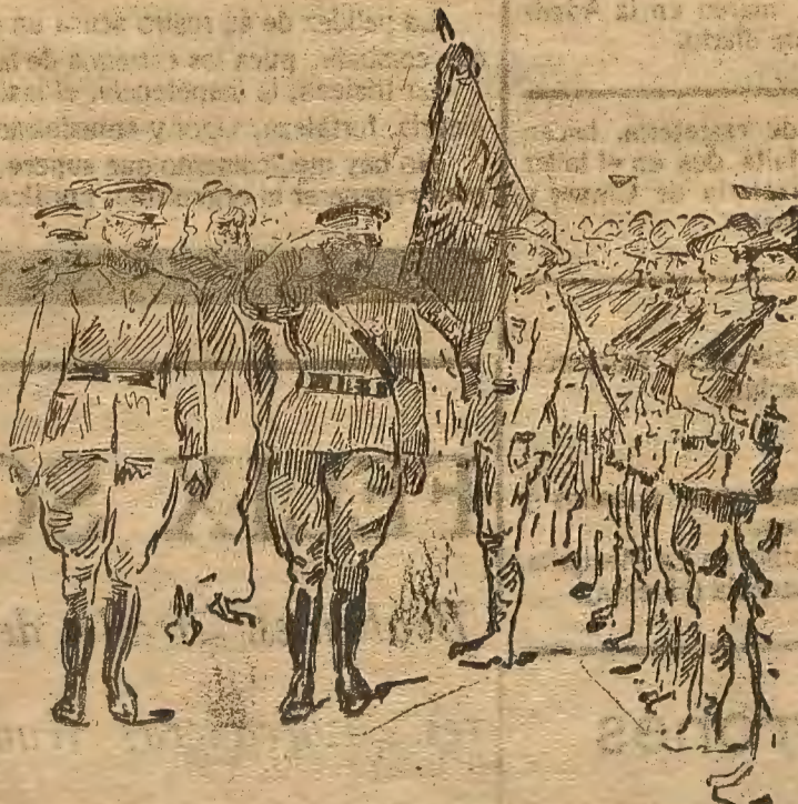
El Alto Comisario general Berenguer revistando una bandera del Tercio Extranjero momentos antes de salir para Gomara.