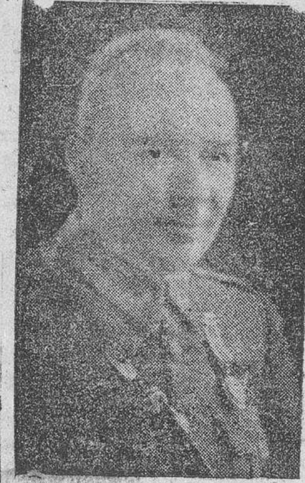
GENERAL MARTIN ALONSO Nuevo jefe de la Casa Militar de Su Excelencia el Jefe del Estado

Decreto por el que se concede a los miembros del Cuerpo Diplomático acreditado en España. GOBERNACION.—Decreto por el que se regula la norma para aumento de precios unitarios de obras ejecutadas por el Ministerio de la Gobernación con posterioridad al primero de abril de 1946, mediante el procedimiento de subasta o concurso.